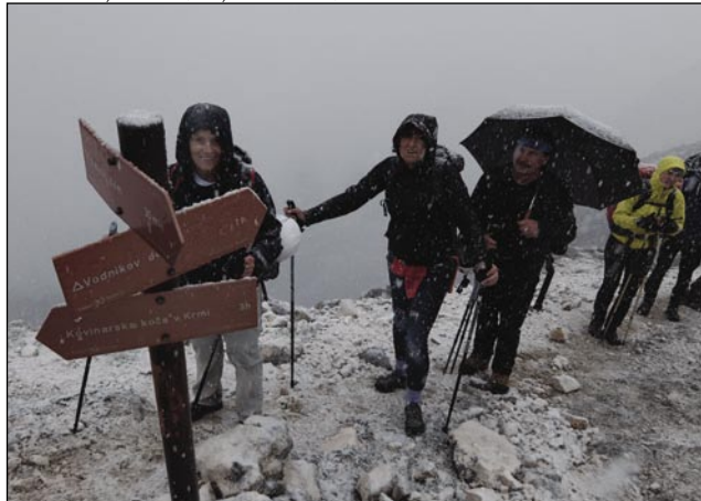
Prauti Triglavskomi domi na Kredarici je hüdo vcuj šlau, toča, snejg, veter so nas sprvajali

ka že samo en serpentin, pa petstau metrov, Triglavski dom smo eške nej vidli. Te so edni že cejlak vömordjani bili, tak smo vögledali, kak gnauk svejta v tistom dokumentarnom filmu, s terim se je začnili oddaja Delta, gde lüstvo pejški dé v velkom snagej gor na planine cejlak tazmantrano. Bili so taši, stero je že samo srce vleklo, do čonta so zmrznjeni bili, cejlak mokri,