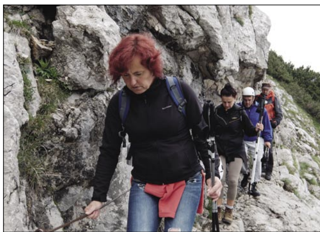
V dosti mejstaj je nevarno bilau ojditi, držali smo se železni vauž

simbol slovenstva pa združuje, vküpdri cejli slovenski narod. Istina, prvo leto smo eške samo tak meli romanja, ka do Triglava, zato ka te smo eške nej bili tak batrivni, ka bi do vreka šli. Zavolo tauga, aj mamu kondicijo, že več mejsecov nazaj smo začnili trenirati, pa nej samo zato, ka mo do vreka šli, liki zato tö, ka smo vsi cejlo paut šli, nej tak, ka bi se menjavali med potjavv kak lani, ka smo v štafetno šli. Trenerali smo