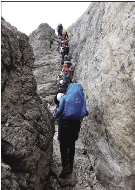
Visiko med skalami

samo nika pauka po glavej, pa gnauk se samo nika sipa, kak če bi pšenico tasipali. Toča je bila, stero je veter tak neso kak gda ftiče s šretom strejlajo. Gda ti je v obraz vdarila, vse je speklo. Eške više pridemo pa pomalek toča ejnja, tau smo mislili, ka zdaj že baukše baude, vej pa tak