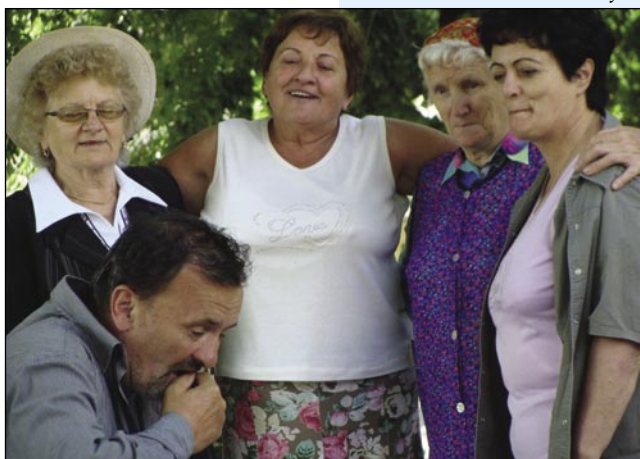
Korajžne ženske, vse so tak špilale kak zaistinske igralke

društva že po desetoj vöri zbirali v vrti. Skupine smo meli iz Porabja, dvej gledališki - iz Števanovec so bili Veseli pajdaši iz Monoštra pa Nindrik-indrik. Obedvej skupini gor drži Zveza Slovencev na Madžarskem. Naša posebna gosta sta bila