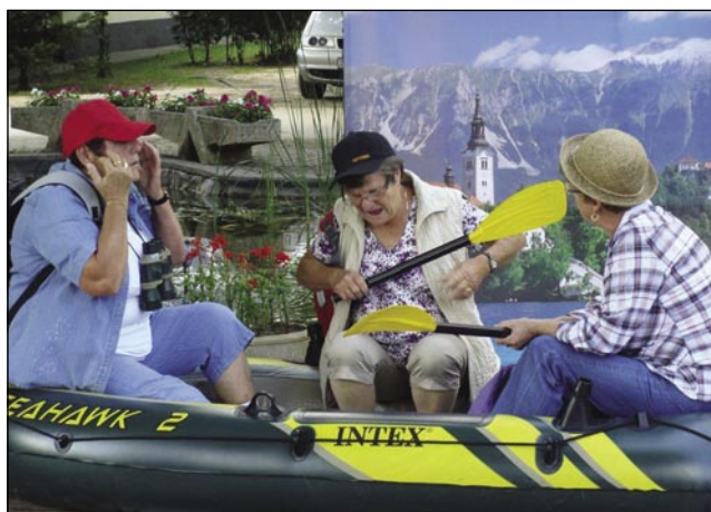
Veseli pajdaši v čunaklina na Blejskem jezери in se pelajo na otok zvonit, naj se jim želje spunijo

vöre, gda smo že vsi vküper prišli. Napravili smo malo osvežitv, ponudili smo gostom vogr-