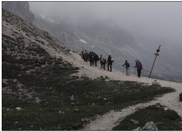
Tü je teren eške nej biu tak težki

Porabsko kulturno in turistično društvo Andovci je že drugo leto organiziralo romanje na Triglav. Tau romanje je simbolična paut Porabski Slovincov k »velkomi« Triglavi, šteri je