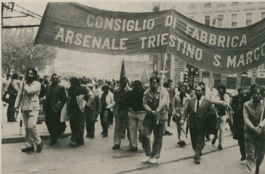
Splošna stavka, sredo, 24. novembra

na 2. strani Kriza v miljski občinski upravi