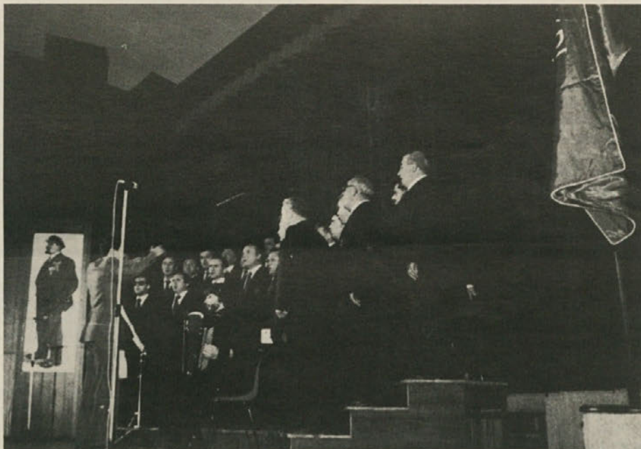
Pevski Zbor Svoboda iz Kočevja, ki je nastopil na proslavi oktobrske revolucije v Boljuncu

Na koncu bodo sekcijski kongresi izvolili delegate na pokrajinski kongres ter obnovili sekcijske vodilne organe (vodstvo in razsodišče).