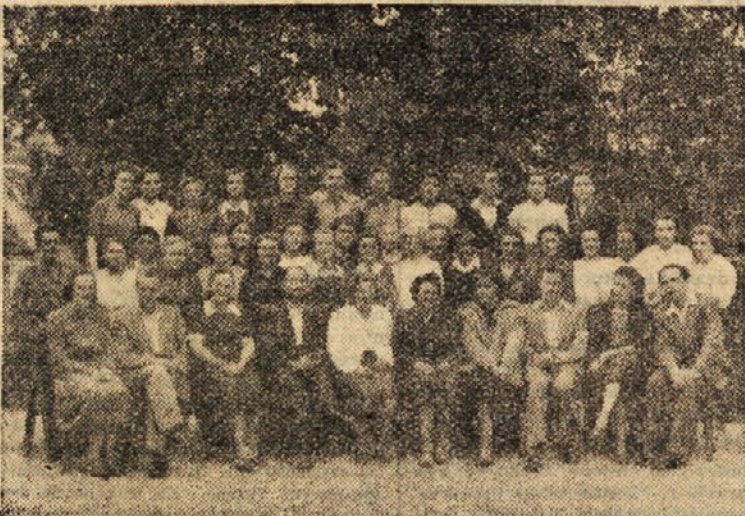
Zaključek gospodinjstvenega tečaja v Trbovljah. (Članek o tem smo že objavili v zadnji številki)

RZPIS NATECAJA ZA SPREJEM UCENCEV Cementarna Trbovlje razpisuje natečaj za sprejem učencev v Industrijsko šolo za učence stroke izdelovanja materiala pri industriji cementa in apna na Savi v Trbovljah. Namen te šole je usposobiti učence teoretično in praktično za kvalificiranje delavce (žalce in mlinarje cementa). Pouk v šoli je teoretičen in praktičen ter traja dve leti. Vabijo se učenci, stari od 14 do 17 let, ki so dovršili sedemletko ali dva razreda gimnazije, da najkasneje do 30. junija t. l. vpošljejo upravi cementarne lastnoročno pisno prijavo in predlože: 1. zadnje šolsko spričevalo, 2. potrdilo KLO o premoženjskem stanju, 3. natančen naslov prijava. Uprava cementarne Trbovlje