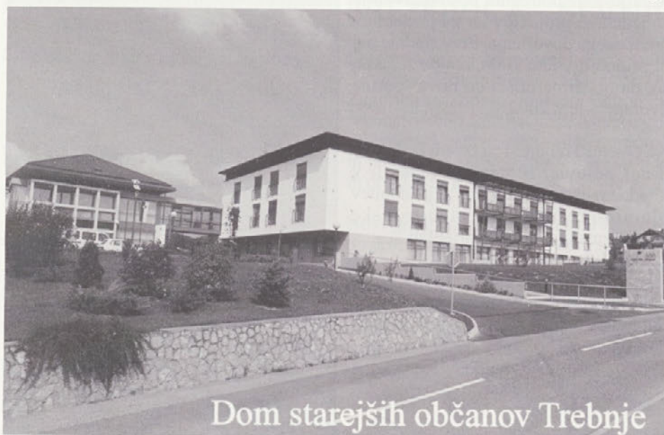
Dom starejših občanov Trebnje