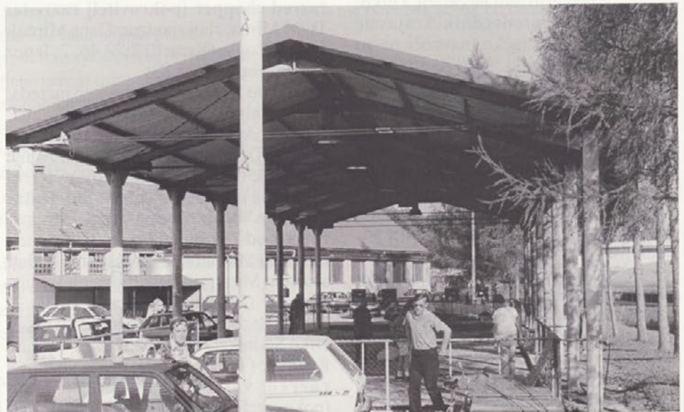
Balinišče skoraj nikoli ne sameva