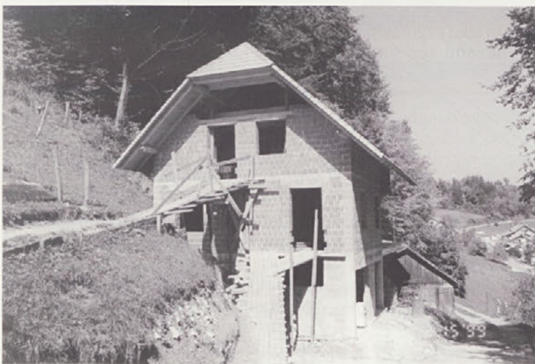
Stanovanjska hiša, ki jo gradi RK za Andreja Pavlina je pod streho.