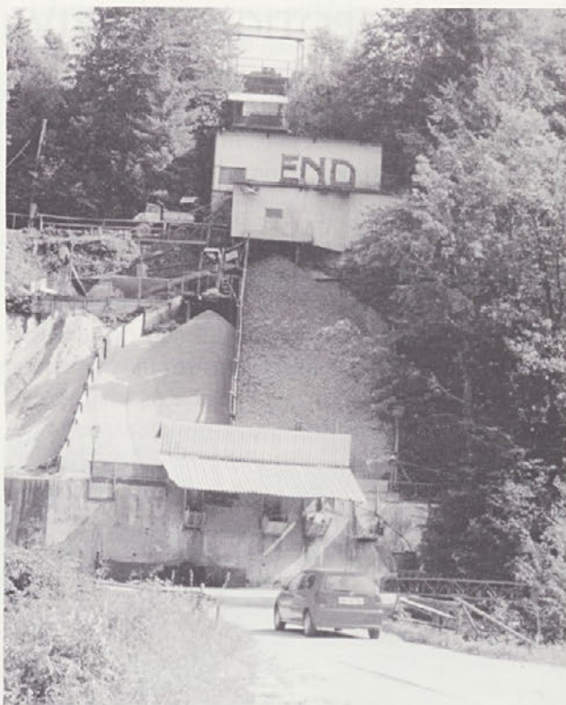
Brez komentarja