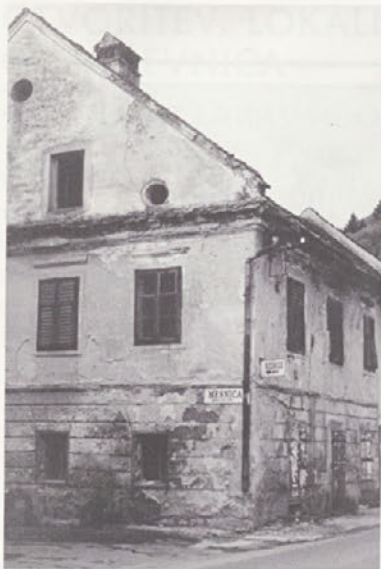
slika Marinove hiše