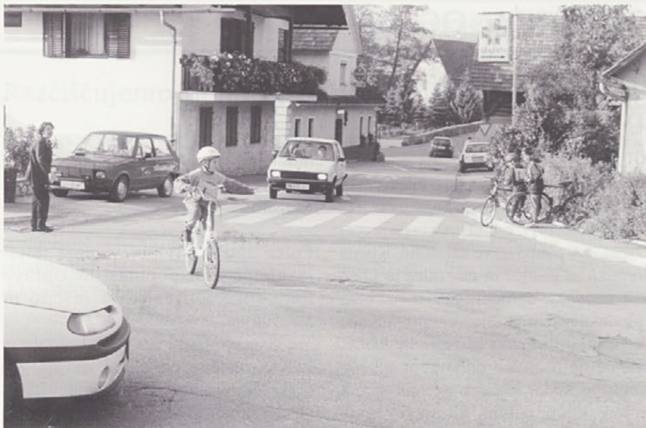
Previdno na cesti! Učiteljica daje še zadnja navodila za varno vožnjo mlademu kolesarju na križišču pri stari šoli na Mirni