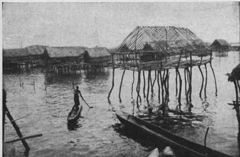
Takele hišice na koleh postavljajo zamorci v Dahomeju.