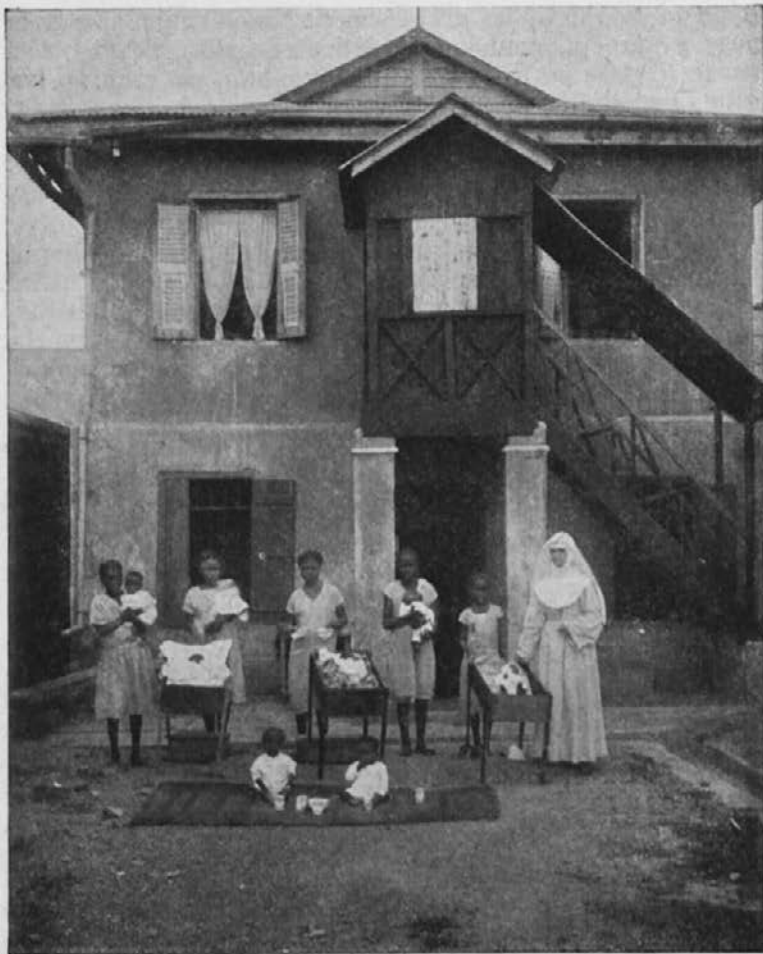
Misijonska bolnišnica in sirotišnica.

Uboga sirota! Tako milo je gledal, ko da me prosi pomoči. Smilil se mi je; toda kako naj mu pomagam, ko tudi mi skoraj od nikoder ne dobimo podpore? Neka vdova, ki smo jo imeli brezplačno v hiši, bi sprejela dečka v varstvo, toda je že imela enega v oskrbi, zato je nismo upali obremeniti še s tem.