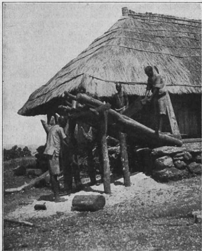
Zamorci žagajo deske za novo cerkev — kar na roko.

Zamorski rod Bimbundo je posebno dovezeten za sv. evangelij. Le škoda, da misijonarjev tako zelo primanjkuje, da bi vse te ljudi poučili v veri in jih pripeljali h Kristusu. Od vseh pastirskih obiskov, ki jih napravim po svoji prefekturi, pridem domov pod vtisom: treba bo še mnogo novih misijonov, da bomo mogli te ljudi, ki tako hrepene po resnici, pripeljati k Bogu. Toda, kako to doseči, ko nimamo niti za sedanje misijone dovolj misijonarjev? To me navdaja s skrbjo, ker kdo vé, ali bodo ti zamorci, ki danes tako zelo hrepene po pravi sv. veri, po desetih ali dvajsetih letih še tako dovezetni za nauk Jezusov.