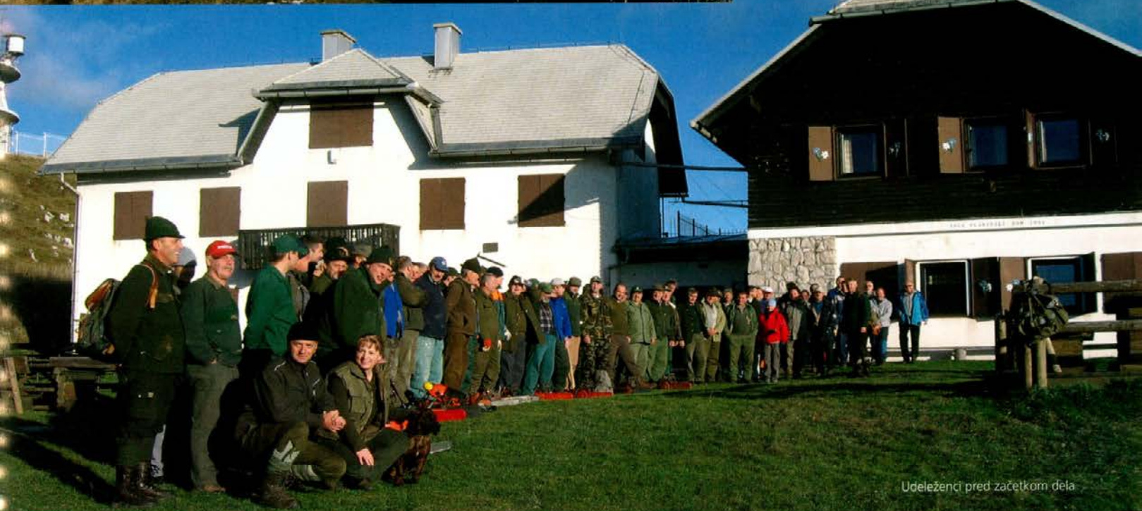
Udeleženci pred začetkom dela