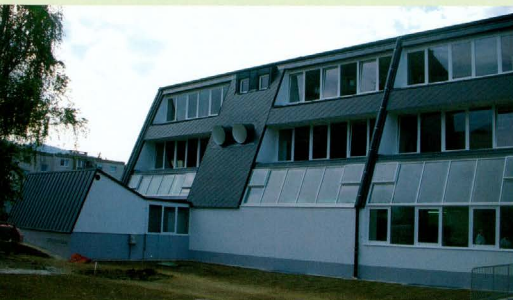
Šola Koroški jeklarji

Vrtcu Maistrova v Slovenj Gradcu pa višamo obstoječi objekt.