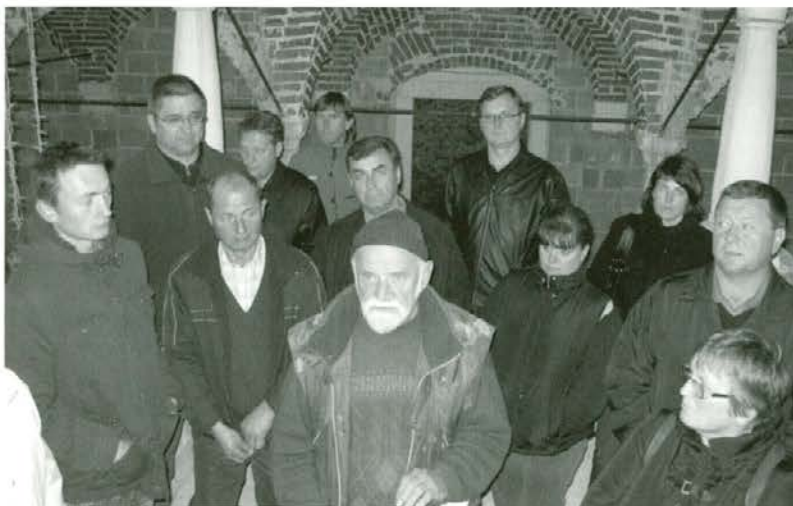
Resnično smo občudovali notranjost gradu