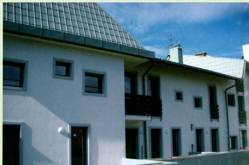
Dom upokoencev Slovenj Gradec