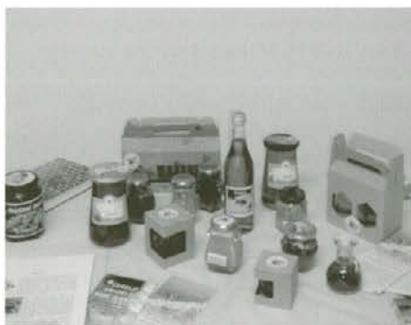
Razstavljeni medeni izdelki

Med pa ni dober samo za grlo. V slovenski tovarni za medicinski material so pripravili obloge za zdravljenje ran, ki vsebujejo kostonjev med. S takimi oblogami iz kostonjevega medu se učinkovito zdravijo šeni in razjede na nogah in pa razjede po amputacijah pri sladkornih bolnikih. Medena obloga zmanjša bolečino in pospeši tvorbo novega tkiva ob robovih rane. Sama medena obloga se ne prime na rano in jo lahko brez bolečin zamenjamo. Sicer pa je med staro zdravilo, saj so nam že babice namazale opekline z medom, da ni bolelo. Ob koncu meseca pa nas čebelarje čaka še ena prijetna dolžnost. Dvajsetega novembra je zopet na vrsti akcija En dan za zajtrk med. Na ta dan bodo otroci v vseh vrtcih dobili za zajtrk domač med. Podarili smo jim ga čebelarji, ob tej priložnosti pa jih bomo še obiskali in jim o čebelicah tudi kaj povedali. Vsi otroci v vrtcih in osnovnih šolah bodo dobili zloženke Čebelica, moja prijateljica, v katerih je opisano življenje čebel in so predstavljene medene dobrote. Tudi na ta način skrbimo slovenski čebelarji za zdravo prehrano in razvoj naših otrok.