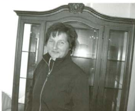
Vrhunsko stilno pohištvo in ženski šarm se lepo ujemata