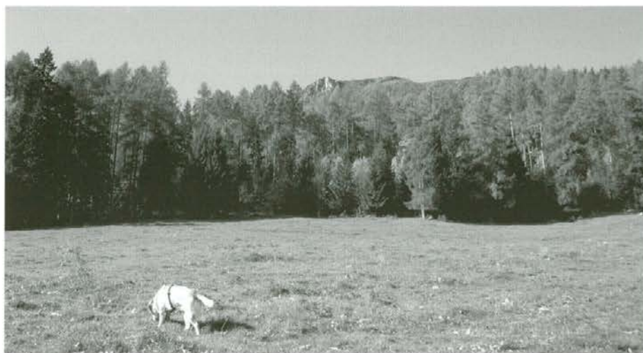
Pašnik na Rišpergu v Podpeci

Lepo oktobrsko vreme je omogočalo, da so lastniki gozdov, gozdni delavci GG Slovenj Gradec in izvajalci del v državnih gozdovih, za katere niso bile izdane koncesije za izvajanje sečnje, gojitvenih in varstvenih del za obdobje 20 let, brez težav izvajali načrtovana dela. Revirni gozdarji so porabili veliko časa za končne prevzeme in pripravo podatkov za obračun gojitvenih in varstvenih del v zasebnih gozdovih, ki jih sofinancira