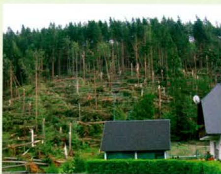
Črnivec, 20. 7. 2008

Ob uspešnem spravilu poškodovanega drevja je potrebno poudariti, da je pri tem nevarnem delu bil največji uspeh, da ni bilo nobene smrtne žrtve ali resnejše poškodbe zaposlenih, kar gre prav gotovo pripisati strokovnemu pristopu gozdarjev ZGS in usposobljenosti sodelujočih izvajalskih podjetij.