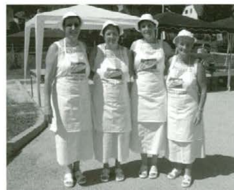
Za našo juho smo dobile bronasto »jakobsko kuhlo«