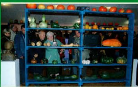
Pisane buče, postavljene na živahno obarvanih policah

Avtorica si je knjigo zamislila tako (in jo tudi uresničila), da je buče razdelila med okrasne, okrogle in okusne.