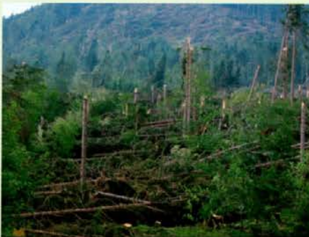
Črnivec, 20. 7. 2008