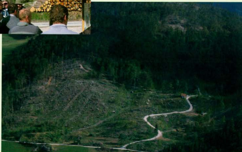
Sanirane površine - pogled iz letala