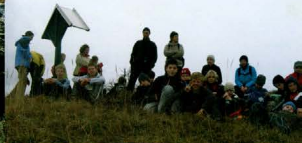
Mladi planinci Planinskega društva Panorama iz Dobrove pri Ljubljani so prisluhnili gozdarju o namenu akcije na vrhu Uršlje gore