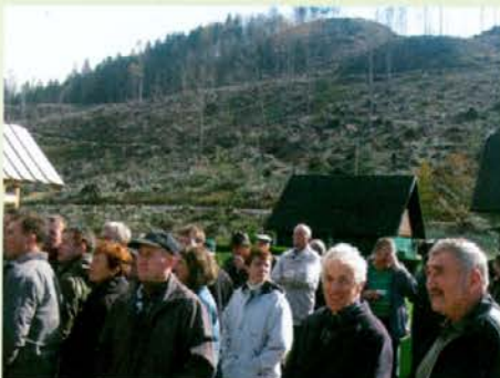
Črnivec, 23. 10. 2009