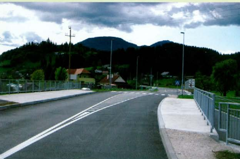
SZ obvoznica Slovenj Gradec

Trenutno na podjetju Dural izvajamo dela pri izgradnji prizidka k proizvodni hali, na