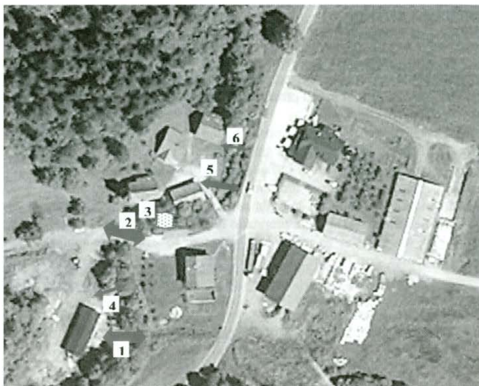
Zračni posnetek domačije Apačnik

1. Lesen most za vprežno živino k apaški žagi je služil za prevoz hlodov na žago in odvažanje rezanega lesa z žage. Ni imel ograje, za kasnejšo uporabo traktorjev je bil prešibak. Most je bil za silo