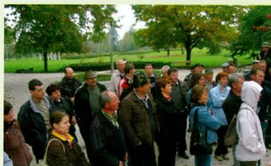
Razlaga v Arboretumu