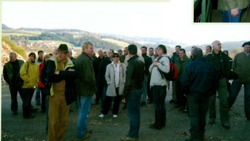
Pred stavbo kogeneracije na ljubje v kraju Wiesenau