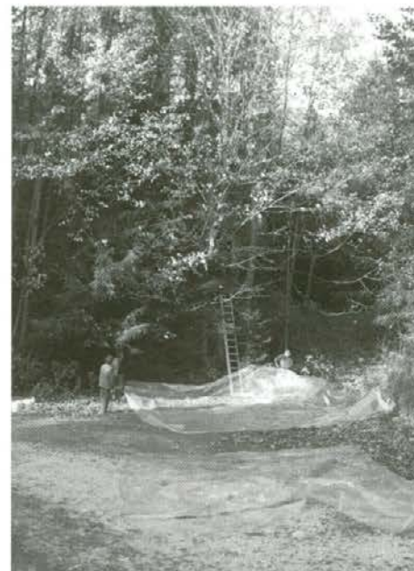
Nabiranje javorovega semena

Lepo vreme je privabilo v gozd v spremstvu gozdarjev šolarje posameznih osnovnih šol. Tudi jeseni je gozd zanimiv in lep!