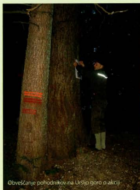
Obveščanje pohodnikov na Uršljo goro o akciji

V kolikor bi se Gora zarasla, bi izginili habitati posameznih zakonsko zaščiteneh rastlinskih in živalskih vrst. Z gozdom porasel vrh bi bil s krajinskega vidika nezanimiv. Zmanjšala bi se rekreacijska in estetska funkcija (planinarjenje, pohodništvo). Drevje v gozdovih na tej nadmorski višini bi bilo zaradi kratke vegetacijske dobe gosto vejnato in manj kvalitetno, lesnoproizvodna funkcija gozda bi bila manj pomembna. Zato koroški gozdarji že vrsto let strokovno načrtujejo posege v zaraščajoče predele