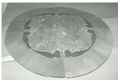
V intarziji za klubsko mizico je izredna dodana vrednost lesu