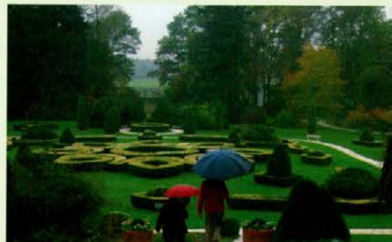
Dež je skalil pogled

Za konec smo si želeli ogledati še Arboretum Volčji potok, kjer na površini 90 ha uspeva približno 2.500 vrst in sort iglavcev in listavcev ter okoli 300 samoniklih zelnatih rastlin, vendar nam je daljši vodeni ogled preprečil jesenski dež. Morda so imeli pri ogledu parka več sreče lastniki gozdov gospodarske enote Pohorje, revirja Pameče in Golavabuka v začetku meseca novembra.