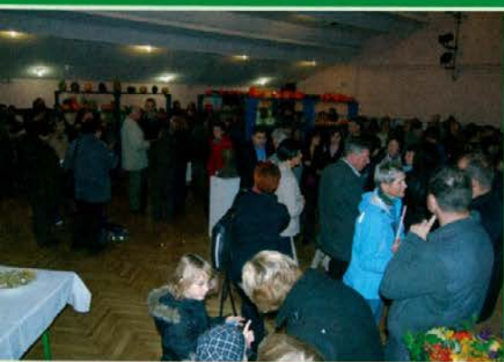
Otvoritev razstave in predstavitve knjige se je udeležilo veliko ljudi