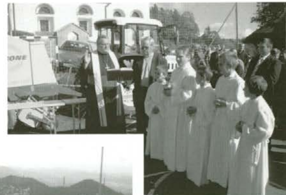
Blagoslov kmetijskih strojev

odojek je dobro teknil in vse skupaj je bilo zalito z dobrim andrejevim vinom. Ker je bilo tako srečanje z blagoslovom kmetijskih strojev prvič v župniji, smo bili vsi istega mišljenja, da naj bi postalo tradicionalno. Saj so stroji danes človeku v veliko pomoč, človek v teh hribih pa je vedno v nevarnosti - zato je blagoslov »od zgoraj« še kako potreben.