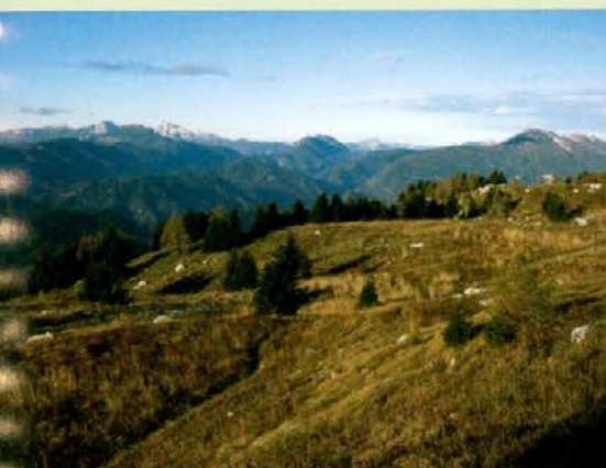
Zaraščajoči vrh Uršlje gore