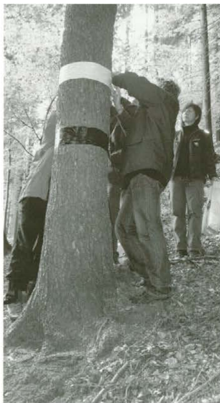
Zaščitni trakovi proti zapredkaricam