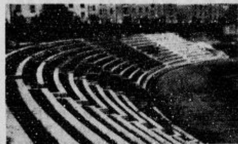
Pogled na novo zgrajene betonske seže na brežinah Stadiona v Ljubljani

Vse tiste soromarje, katere je bolezen privezala na bolniško posteljo ali pa zaradi visoke starosti nikakor ne morejo priti 3. in 4. julija na Brezje, pa prosimo, da pošljejo koga izmed svojih znancev kot svojega namestnika na Brezje ali pa se vsaj pisмено oglašajo in vsaj do 1. julija pošljejo svoje pismo na naslov: Jeruzalemsko romanje. Frančiškanski samostan na Brezjah (Gorenjsko). Na Brezje vabimo za 3. in 4. julija tudi sorodnike in znance že pokojnih soromarjev; če jim pa ni mogoče priti, naj se vsaj pisмено zglašajo na gornji naslov in naj v pismu sporoče kaj zanimivega, zlasti iz zadnjih dni življenja t. sorodnika jeruzalemskega romarja, zraven pa prilže še njegovo sliko ali spominsko podobico.