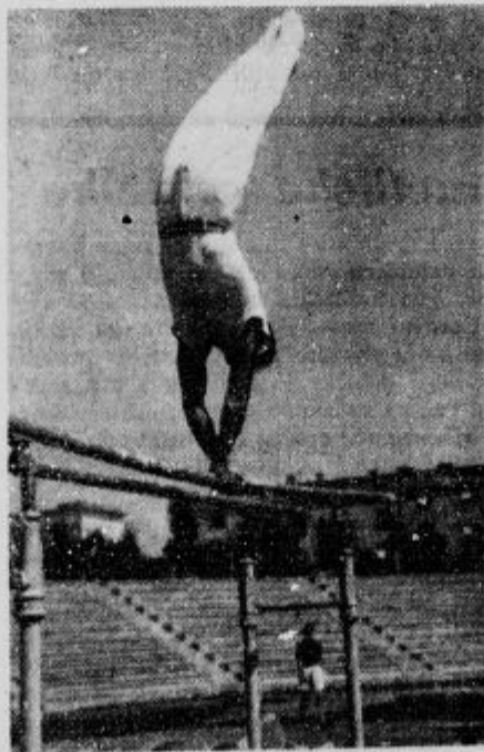
Slovenski fantje, ki bodo nastopili pri mednarodnih tekmah na Stadionu, se dan za dnem pridno vežbajo s vrstolomnih vajah