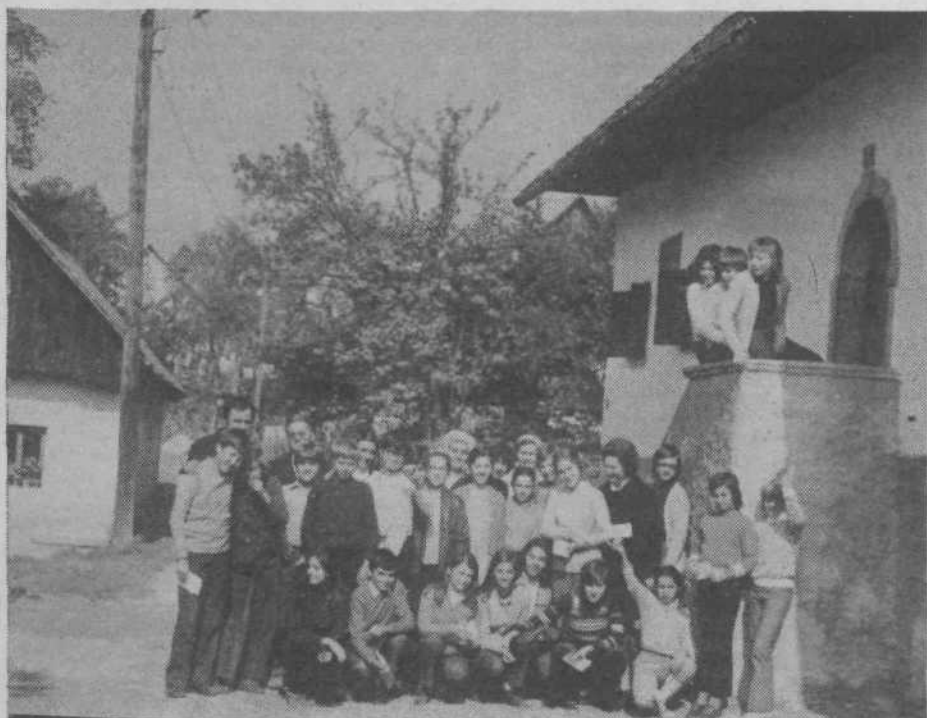
Beograjski gostje z učenci OŠ Ketteja in Murna ob obisku Prešernove rojstne hiše v Vrbi