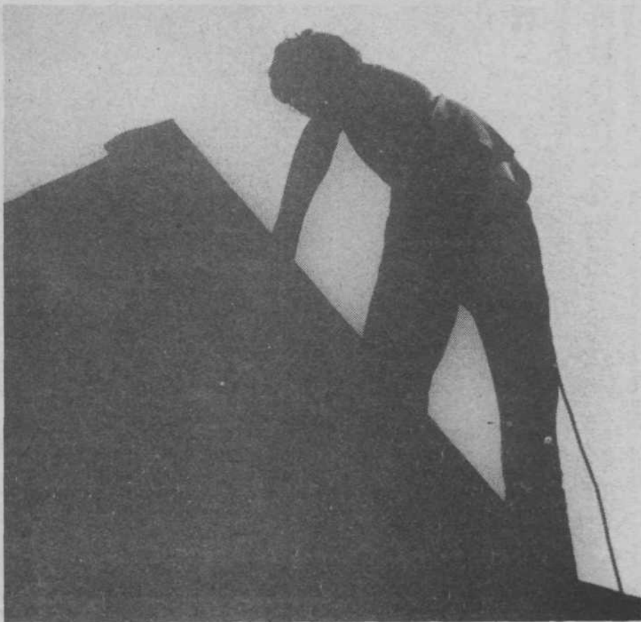
Človek hoče navzgor