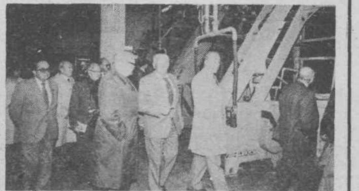
Španski borci so si na obisku v vevski papirnici ogledali tudi proizvodne prostore.

Zadnji dan so se španski borci ogledali gradnjo PST in vevsko papirnico kot pomembno organizacijo boja za delavske pravice že pred vojno, vojaško gimnazijo Franc Rozman-Stane, vojašnico Bratstva in enotnosti in Cankarjev dom. Tridnevni obisk je prehitro minil v tovariškem, prijateljskem ozračju. Nadvse zadovoljni so se španski borci poslovili od nas. AM - JK