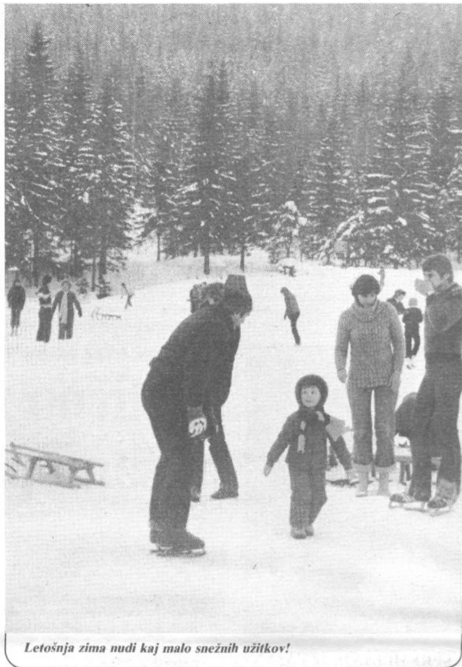
Letošnja zima nudi kaj malo snežnih užitkov!