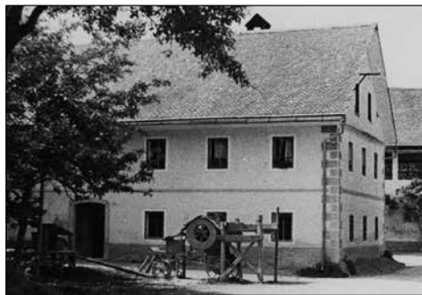
Šinkarjeva stara hiša.

"Lepo je biti kmet. Če bi bil znova mlad, bi bil spet kmet, a zagotovo bi študiral tudi glasbo," je nekoč povedal.