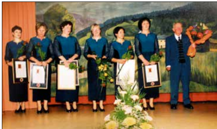
Na koncertu ob 30-letnici delovanja seksteta, 27. 11. 1999.

Za vsako okroglo obletnico smo pripravili koncert. Z atom smo se pogovarjali, koga bi povabili v goste, in vedno je imel že vnaprej pripravljen predlog. Zanimivo je, da nas je ponavadi on vprašal, ali bomo imele nove obleke. Rad je videl, da