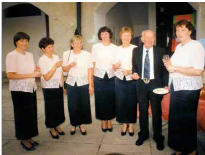
Vedno nasmejan med svojimi dekleti.

zapele, bile smo zadovoljne, ata pa še bolj. Ves čas mu je šlo na smeh in ni nas mogel prehvaliti. Vsa-ki je dal čokolado – za pohvalo in vzpodbudo za naprej.