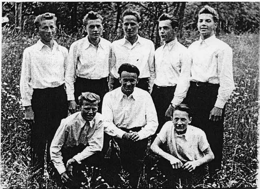
Člani Mladinskega pevskega zbora KUD Bukovica, leta 1956, iz katerega so izšli Fantje s Praprotna.