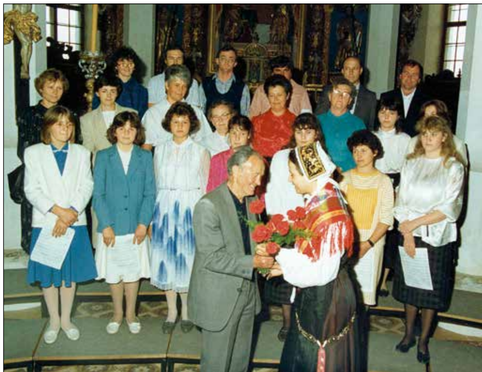
Mešani cerkveni zbor na reviji cerkvenih zborov v Sorici.