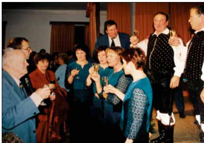
Nazdravljanje po koncertu na Bukovici.

smo bile tudi za oko prijetne, lepo oblečene.