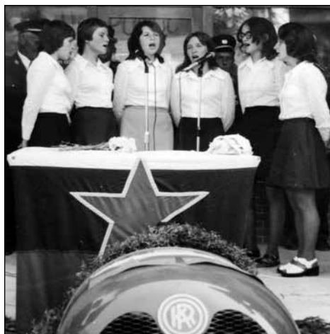
Vokalni sekstet Dekleta z Bukovice.