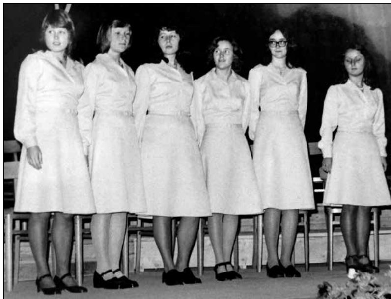
Zgodnejša slika seksteta Dekleta z Bukovice.

Za potrebe cerkvenega petja je vodil tudi otroški pevski zbor. Ko so Fantje s Praprotna odšli k ansam-