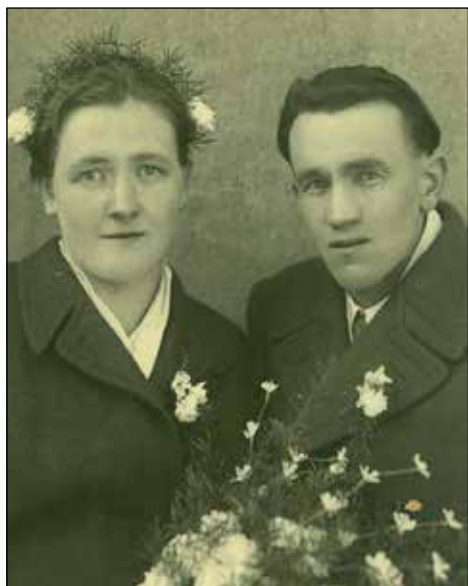
Poročna slika.

Ko sem prišla k hiši, je bilo takoj treba prijeti za vsako delo. Za tiste čase so imeli precej veliko kmetijo. Redili so 12 do 15 govedi, 2 konja in po 5 prašičev. Pridelovali so vse kulture, več vrst žita. Vse se je obdelovalo ročno. Sejali so tudi lan. Mati je bila dobra predica. Pri hiši je še sedaj nekaj domačega platna, ki ga je naredila. Jaz sem se naučila vse o pridelovanju lanu, vendar se presti nisem naučila.