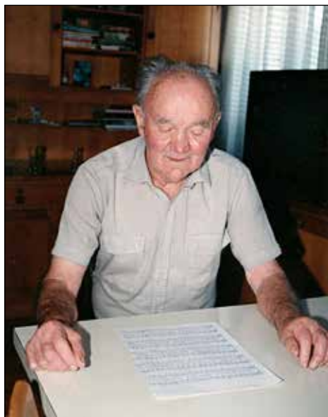
Šinkarjev ata študira pesem.

To je bilo prvo obdobje malo bolj intenzivnih priprav in prvi odmeven nastop. Pesmi smo lepo