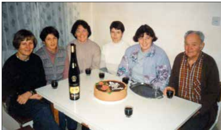
Torta po obeh koncertih, samo devet dni pred njegovim slovesom.

Tudi na koncert, ki smo ga čez 14 dni ponovili v Kristalni dvorani v Škofji Loki, nas je spremljal, čeprav težko. Obljubil je, da nam bo pripravil tor-