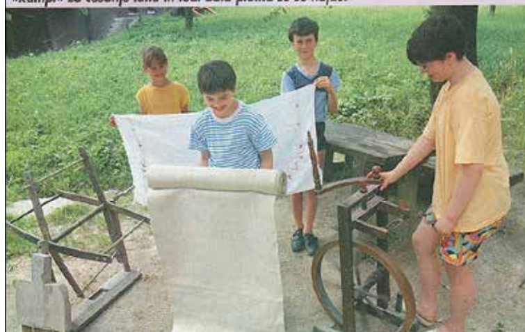
Članek iz Pila: Na Bukovici so včasih sejali lan ...

Na Bukovici so včasih sejali lan. Na domačiji »pr' Šinkarim« še vedno hranijo kolovrat, »kampil« za česanje lana in tudi bala platna se še najde.