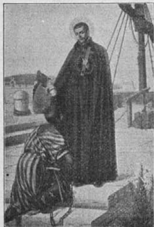
Sv. Peter Klaver, apostol zamorcev, prosi za nje in za naše podjetje!