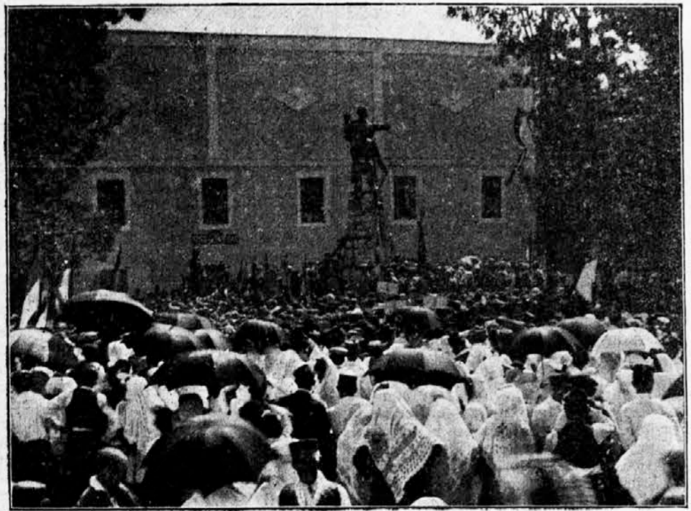
Mnoštvo naroda, kod svečanog otkrića spomenika kralju Petru Velikom Oslobođiocu i Herecegovačkim ustašama.

Taj tečaj treba da stvori u bjelovarskoj župi novi zbor prednjaka, koji će svojim delom uneti duh života, ne životinjska u naša društva.