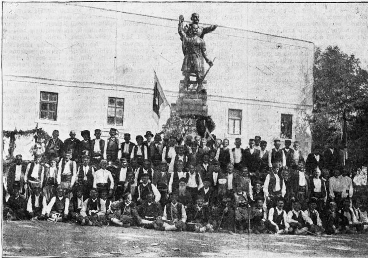
Još danas živi ustaše iz godine 1875 pod novo otkrivenim spomenikom.

Ovo neka ima na umu svaki mali i veliki čovek širom naše ujedinjene Otadžbine, jer Jugoslovensko Sokol-