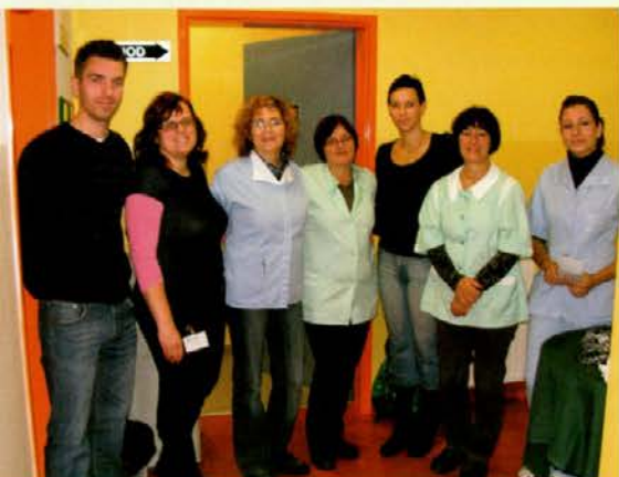
Izvajalci zdravstvene delavnice v Podvelki