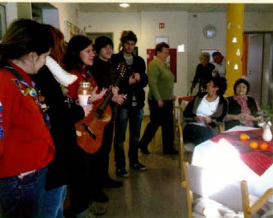
Obiska plamena Luči miru iz Betlehema v domu za ostarele v Slovenj Gradcu

Z roko v roki je bilo geslo lanske akcije Luč miru iz Betlehema, ki jo skavti in taborniki že 22. leto prinašamo v Slovenijo, tudi na Koroško. Malo zguljena fraza, "Z roko v roki", boste