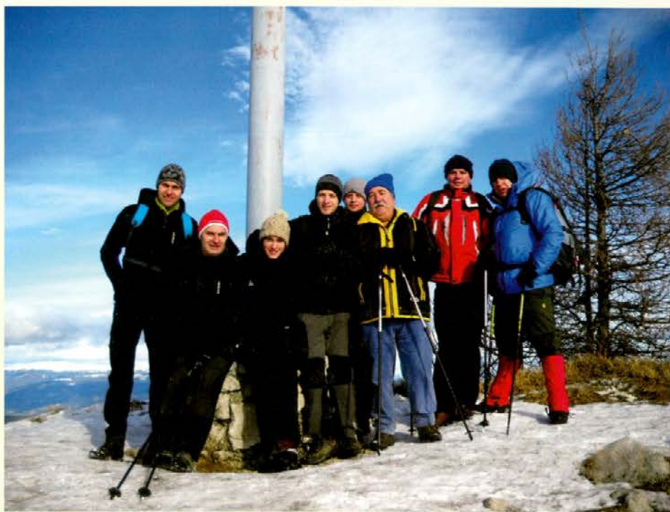
Vzpon je v dobri družbi lažji.

Uršlja gora, naš koroški Triglav. Saj verjamem, da jo skoraj vsakodnevno uzrete skozi svoje okno ali pa skozi okno svojega avtomobila, ko se vračate kje od daleč. Rečem vam: če jo vidite, ste že skoraj doma. Z Raven na Koroškem smo se januarskega sobotnega jutra napotili proti Kotljam, nekoč slovečemu Rimskemu vrelcu, da si napolnimo plastenke frišne kiseve vade za s sabo. Objekt Rimskega vrelca sicer še stoji, okna in vrata so zabita z deskami, voda, ja, voda pa še teče. "Glejte," sem rekel prijateljem, "vidite, zdaj se pa že tu nekaj dogaja!" ker je bilo zadaj parkiranih polno avtomobilov. Žal je bil kompleks še vedno nedotaknjen, z avtomobili pa so pripeljali otroke na bližnje smučišče; vsaj nekaj radosti ... Potem pa smo jo kar po položni cesti mahnilo proti Šrotneku. Eni bi šli po strmi čez Kozji hrbet, pa so se zame zbali, če bi bilo slučajno še ledeno (bil sem najstarejši med mladci ja starčke je pa treba ahat , a ne), pa mislim, da verjetno ni bilo pretirano ledeno, vsaj na poti, po kateri smo se potem mi