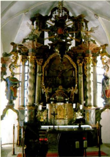
Oltar v cerkvi sv. Uršule

doline oziroma iz Slovenj Gradca mimo Sel, Poštarskega doma in čez Plešivec. Ja, ena je še, in sicer z Razborja, na našo Goro pa lahko pridemo tudi iz Belih vod. Mi smo ubrali eno našo, bolj svojstveno pot, zato ker sem želel najprej poslikati nekoč biserno lep in spominov poln Rimski vrelec. Kot sem že omenil, smo si tu natočili za na pot kiseve vade . Namenoma nisem napisal, kako dolgo smo hodili, priznam pa, da bi me takoj ujeli, ker sem bolj počasen. Pa ne zaradi pomanjkanja kondicije, ampak samo zato, da bi za vas vsrkal čimveč lepih vtisov. Poti so dobro markirane in na tablah točno piše, kako dolgo se hodi, če si dovolj hiter, seveda. Priporočam vam, da si izberete tisto, ki vam bo najbolj ustrezala. Kot sem že obljubil, drugič pa že na malo bolj zahtevno in malo višje, mogoče pa vas vzamem s seboj.