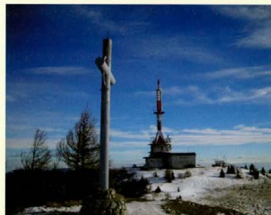
Križ in televizijski stolp na Uršlji gori