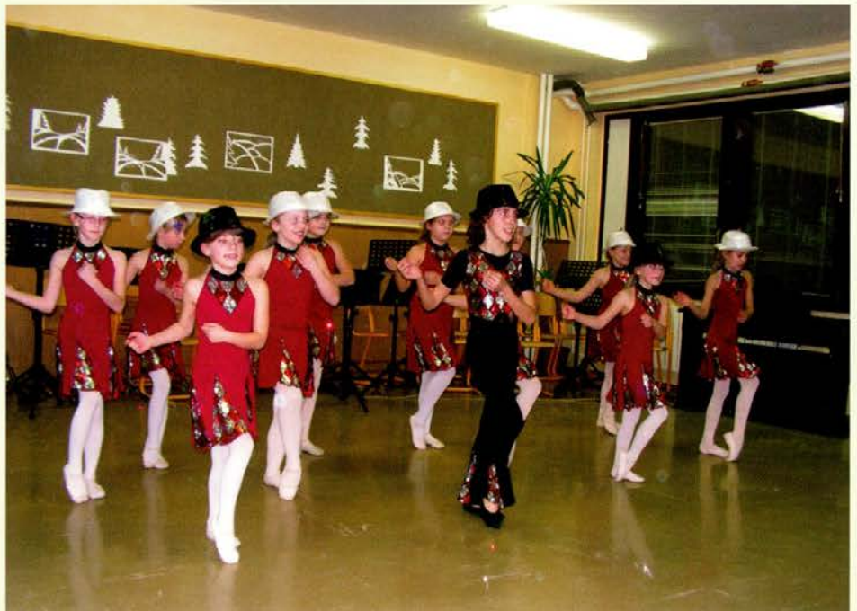
Nastop skupine baletnic prvega razreda radeljske glasbene šole

Št. 1, december 2012 ŠOLSKI ČASOPIS OŠ Neznanih talcev Dravograd