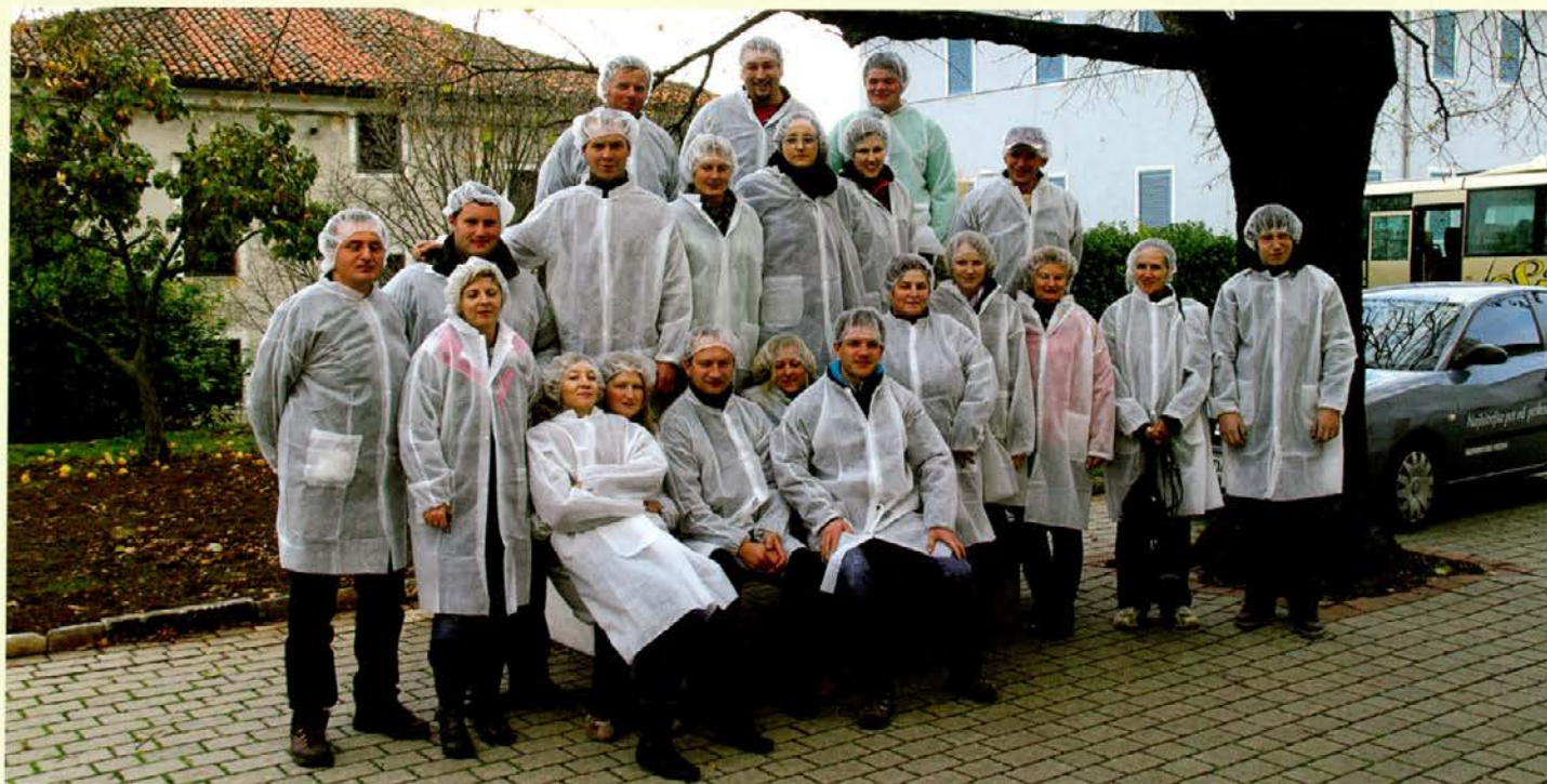
Plesalke in plesalci FS KD Gozdar so v Lokvah na Krasu postali pravi specialisti za pršut

smo šli še v manjšo trgovino, kjer smo lahko kupili njihove proizvode, nato pa proti zadnji postaji naše strokovne ekskurzije v gostišče Spark in Sežani. V gostišču smo imeli večerjo, ki nam je po napornem dnevu zelo teknila. Poskrbljeno je bilo tudi za živo glasbo in po večerji smo se zavrteli v ritmih zabavne glasbe. Čas ob pijači, klepetu, glasbi in plesu je zelo hitro minil in okoli polnoči smo se že odpravili nazaj proti Koroški. Zaključili smo zanimivo potepanje in ogled za Kras značilnih dogodkov, ki so tudi sestavni del folklorne v tej zanimivi pokrajini. Pot nazaj je hitro minila, malo smo še klepetali, malo zadremali in že smo bili doma. Izlet nam bo ostal v zelo lepem spominu, saj smo videli in izvedeli veliko novih stvari, ki se skrivajo v naši čudoviti deželi Sloveniji. Člani FS KD Gozdar iz Črne na Koroškem vam želimo srečno, veselo in prijetno novo leto 2013. Srečno!