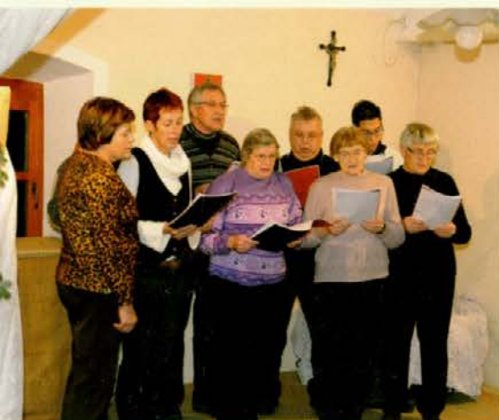
Ljudski pevci z Ojstrice so uvodoma zapeli na prireditvi Veselo v novo leto.