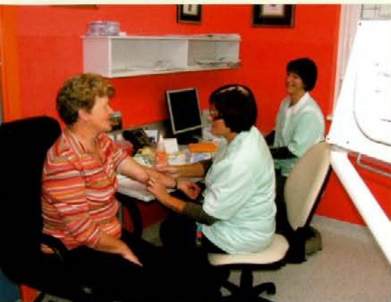
Odvzem krvi za določitev krvnega sladkorja in holesterola