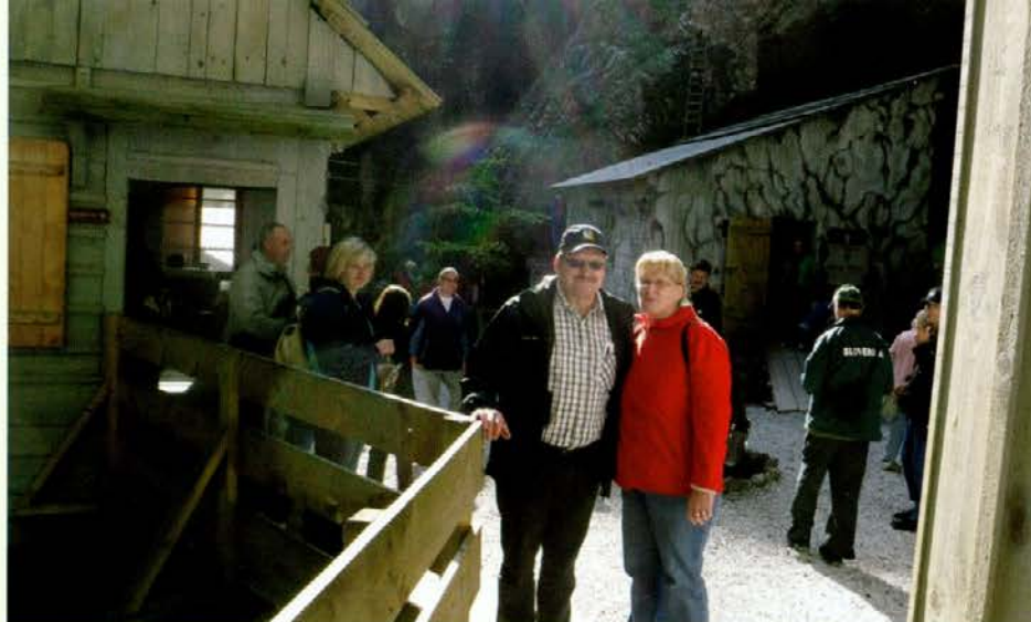
Ogledali smo si Bolnišnico Franjo.

Združenje slovenskih častnikov za svoje člane vsako leto organizira izlet, na katerega povabi tudi predstavnike Lovske družine SG. To leto je bil organiziran ogled Bolnišnice Franja in Škofjeloškega gradu.