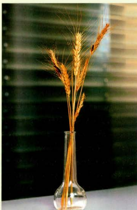
Okužen žitni klas