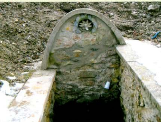
Voda pri Rimskem vrelcu še teče.

doline oziroma iz Slovenj Gradca mimo Sel, Poštarskega doma in čez Plešivec. Ja, ena je še, in sicer z Razborja, na našo Goro pa lahko pridemo tudi iz Belih vod. Mi smo ubrali eno našo, bolj svojstveno pot, zato ker sem želel najprej poslikati nekoč biserno lep in spominov poln Rimski vrelec. Kot sem že omenil, smo si tu natočili za na pot kiseve vade . Namenoma nisem napisal, kako dolgo smo hodili, priznam pa, da bi me takoj ujeli, ker sem bolj počasen. Pa ne zaradi pomanjkanja kondicije, ampak samo zato, da bi za vas vsrkal čimveč lepih vtisov. Poti so dobro markirane in na tablah točno piše, kako dolgo se hodi, če si dovolj hiter, seveda. Priporočam vam, da si izberete tisto, ki vam bo najbolj ustrezala. Kot sem že obljubil, drugič pa že na malo bolj zahtevno in malo višje, mogoče pa vas vzamem s seboj.