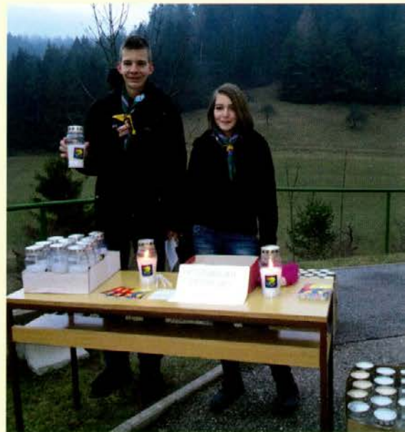
Deljenje plamena v Doliču

Plamen je tako v soboto, 15. decembra 2012, priletel iz Betlehema (seveda v posebni posodi, sicer ga na letalo ne bi dovolili nesti) na Dunaj, kjer so ga predstavniki različnih držav, predvsem skavti, sprejeli, z njim prižgali svoje sveče in z njimi odšli v svoje države. Plamen so v začetku prenesli v Ljubljano, Ankaran in Gornjo Radgono, od koder smo ga sprejeli tudi mi – skavti stega Zvezdni veter – ter ga prinesli med vas. Plamen smo v enem samem koncu tedna od 21.–23. 12. razdelili med mnoge – tudi z vašo pomočjo. Med drugim je zasijal na vrhu Uršlje gore, svetil je županom, šolam, mnogim podjetjem, Varstveno