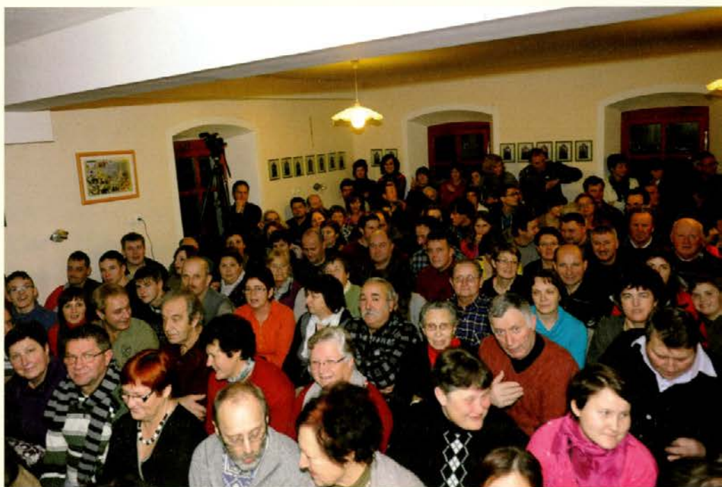
Dvorana je bila dvakrat nabito polna.