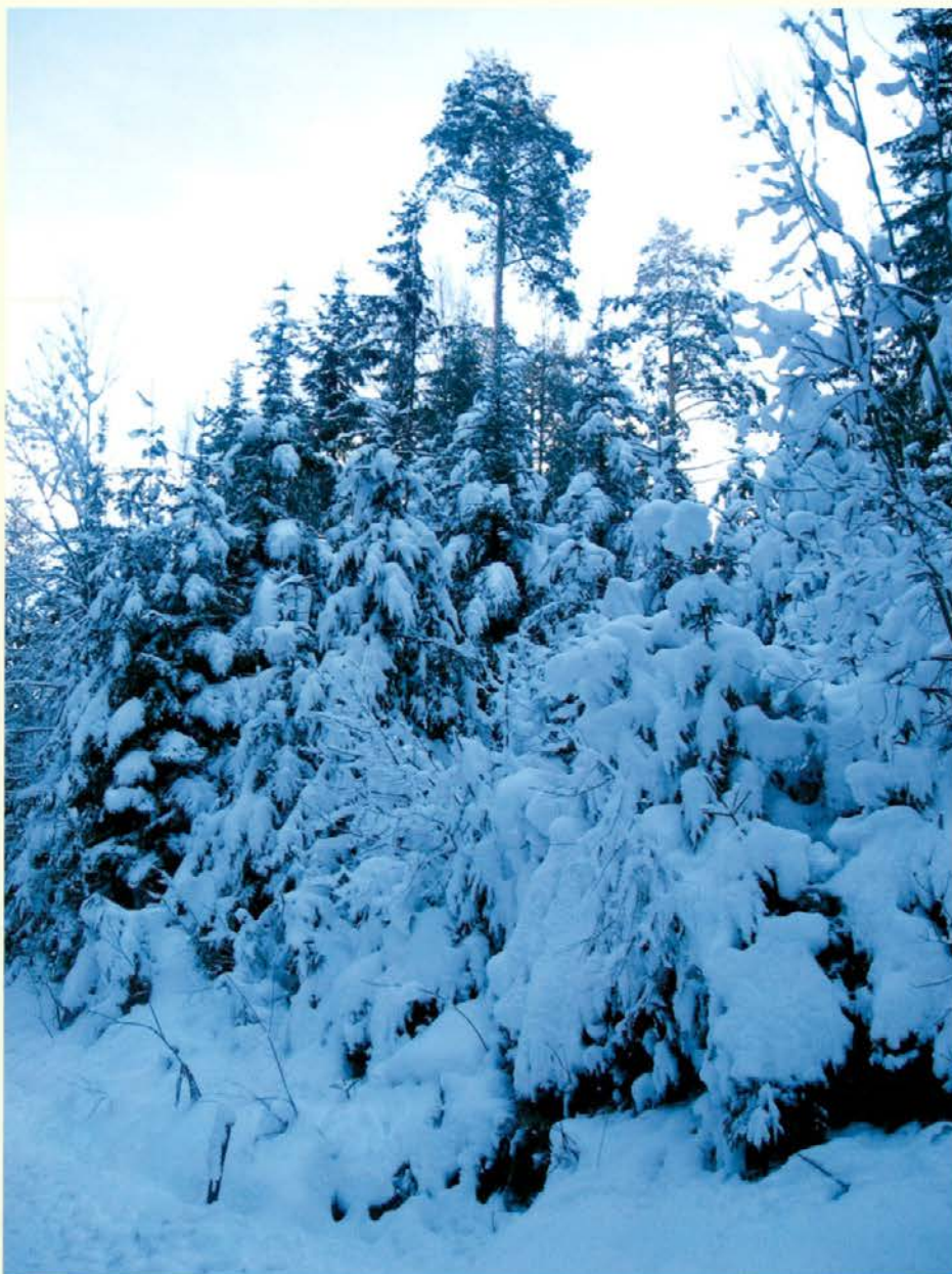
Zimska idila v decembru 2012

Veliko dela so imeli že v decembru organizatorji 7. licitacije vrednejših sortimentov, še posebno posamezni revirni gozdarji, ki so pomagali in svetovali lastnikom gozdov pri izbiri in vrednotenju na licitaciji ponujenih dreves. Dovoz lesa na mesto licitacije v Slovenj Gradec je potekal od 17. decembra 2012 do 11. januarja 2013. Licitacijo ob pomoči gozdarjev Zavoda za gozdove Slovenije organizirata Društvo lastnikov gozdov Mislinjske doline in Zveza lastnikov gozdov Slovenije. Oglede licitaciji namenjene hlodovine za kupce bo do 28. januarja, odpiranje ponudb bo 29. januarja, dan odprtih vrat pa 7. februarja. Ta dan bo v Slovenj Gradcu pravi gozdarsko-lesarski praznik! Na tej prireditvi se