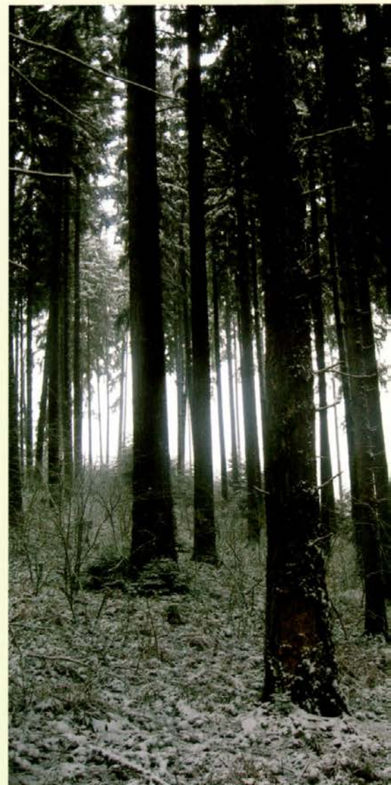
Rezultat ptičjega izvedenega rentgenskega pregleda na duglaziji

21. decembra 2012 je bil napovedan konec sveta. Kot vidite, do tega uničujočega dogodka ni prišlo! Novo številko Viharnika smo uspeli brez težav urediti in izdati. Želim vam veliko mirnih užitkov ob prebiranju našega mesečnika na začetku nemirnega leta!