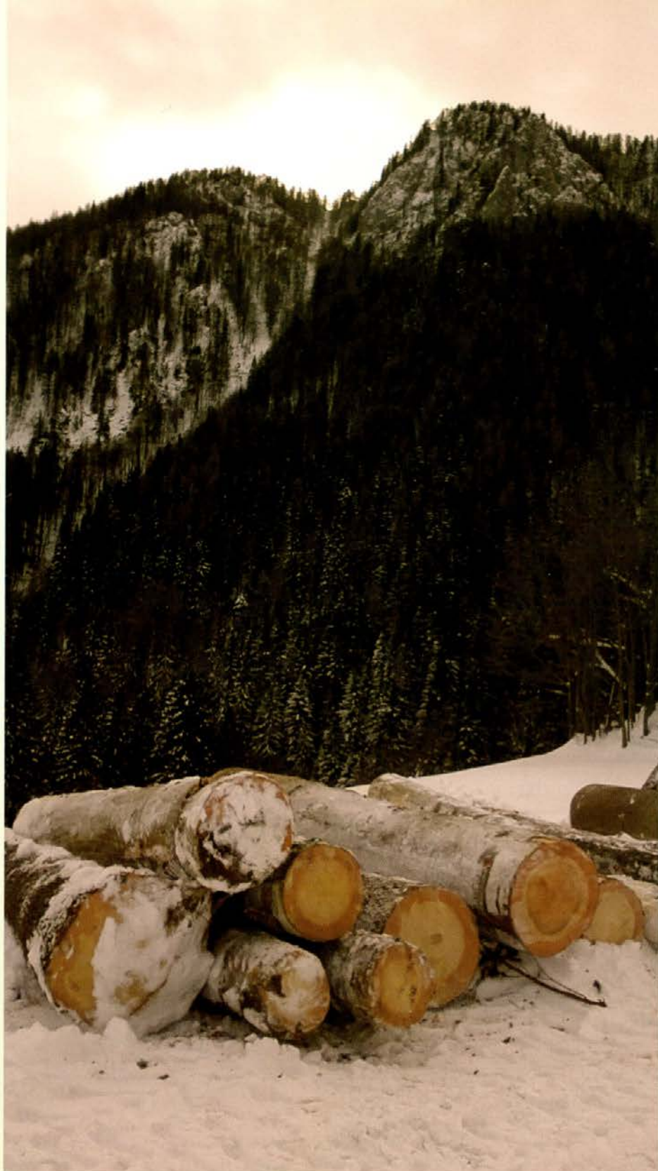
Pri Ratihu v Bistri sodelujejo tudi na letošnji licitaciji

V decembru so bile najnižje dnevne temperature v slovenjgraškem