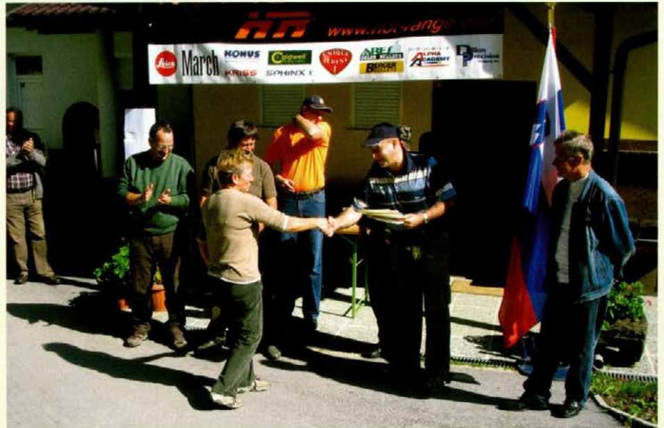
Dekleta so povsem enakovredne tekmičice fantom.

disciplini malokalibrska puška v prostostoječem stavu. Tekmovalci so v času do razglasitve rezultatov tekmovalca pomirili adrenalin pri mizi z malico, ki so jo častili člani ZŠČOD, lovska družina pa je poskrbela, da so nadomestili izgubljeno tekočino. Izgubo tekočine je povzročil lep in sončen dan, ki je še posebej polepšal to srečanje. Po razglasitvi rezultatov in podelitvi diplom je bilo organizirano še prosto streljanje s trofejnim orožjem, ki nam je