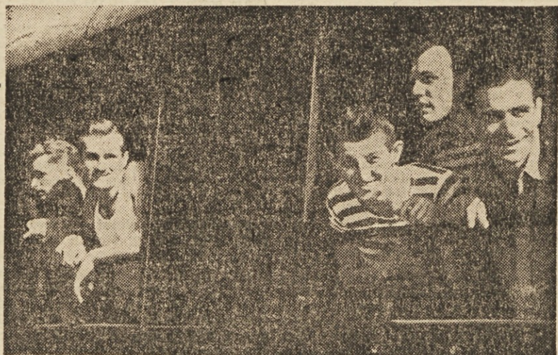
Odredovo moštvo ob odhodu iz Ljubljane na težko preizkušnjo v Banja Luko. Po nasmejanih obrazih bi skorajda sklepali, da so bili fantje optimisti