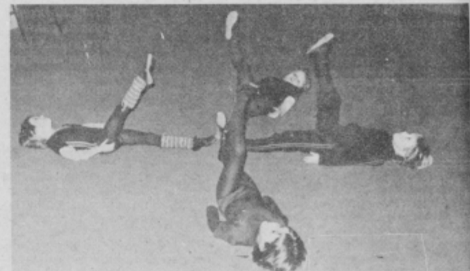
... Z ogromnim »svinčnikom« pišemo ogromne črke po zraku ...