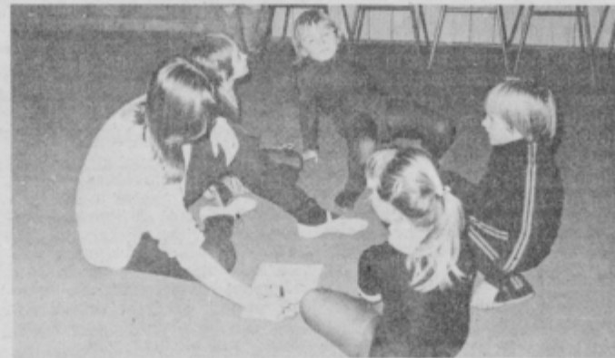
... Danes pa nas veliko manjka ...