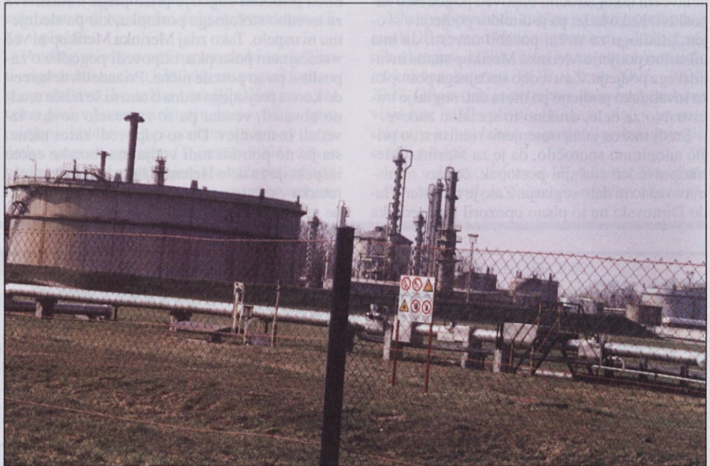
Po reorganizaciji s kadrovskim prestrukturiranjem sedaj na lokaciji Nafta posluje holding z več hčerinskimi družbami.

S kakšnimi občutki eden najbolj pokončnih sindikalnih zaupnikov v Sloveniji zapuščata zahtevno dolžnost, ki jo je odgovorno in uspešno opravljal vrsto let? »Glede na dolgoletno agonijo Nafta ni bilo lahko biti sindi-