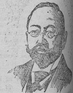
General Terauchi. Dr. Motono Itschiro.