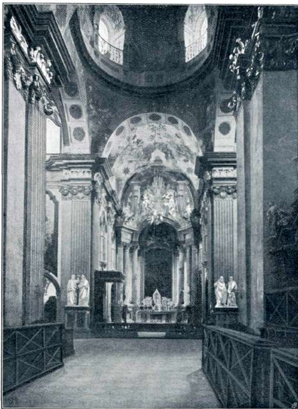
V VELEHRAJSKI CERKVI

Stopili smo v nenavadno veliko cerkev. Mogočen, harmoničen vtis! Malo cerkvâ sem dosedaj videl, ki bi tako enotno in silno delovale na človeka. Ta vtis je težko popisati. Slog je lep, bogat barok. Sedanja cerkev, taka kakor je, obstoja od l. 1735. Na istem mestu pa se da dokazati cerkev že mnogo, mnogo