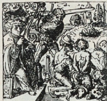
Slika kaže, da so za časa upora sekali glave upornikom kar skupinsko. Ena glava je že odsekana, dve še čakata na udarec.

Časovno bi kot drugi predhodni upor prišel v poštev odpor angleških baronov proti angleškemu cesarju Ivanu Brez Zemlje (1199—1246), ki je zaradi vojne s Francijo državno blagajno popolnoma spraznil, zato je moral, obubožan in brez vsake moči, pristati na zahteve fevdalcev in te zahteve potrditi v državni listini „Magna charta libertatum“ leta 1215. Na podlagi te listine je prišel do najvišje zakonodajne oblasti poznejši angleški parlament in kralj je postal samo simbolična figura državne oblasti, ne-