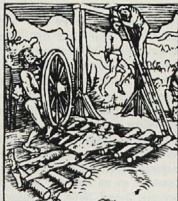
Upornike so največkrat obešali kar na drevesa.

Po časovnem vrstnem redu bi na četrto mesto postavili upor tekstilnih delavcev v Florenci v Italiji dne 20. julija 1378. Tega upora niso začeli kmetje, temveč delavci, imenovani čompi in mali rokodelci. Končal se je orav tako z neuspehom kot vsi drugi slični upori, ker tudi delavci niso bili organizirani, toda porazu je sledil izredno krut obračun z upornimi delavci, ki so v masah bežali iz Florence.