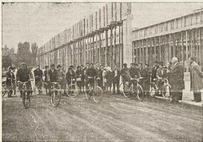
Tovarna v izgradnji

Za znižanje lastne cene je podjetje kupilo v Italiji široke frotir statve in ostale naprave, ki pogojujejo večjo proizvod. z manjšo delovno silo. V barvarno se je v preteklem letu in letos vložilo precej sredstev. Ta vlaganja še zdaleč ne zadostujejo, niti niso zaključena. Spričo povečanih potreb po barvanju preje pa vzporedno nastaja problem pomanjkanja vode. Za odpravo teh pomanjkljivosti bo potrebno tudi v prihodnje vlagati še večja sredstva, če hočemo v korak s sodobno proizvodnjo. Povečano proizvodnjo pa nam nalagajo tudi konkurenčni činitelji, kajti v pogojih gospodarske reforme tekstilna industrija ni na zavirljivem mestu.