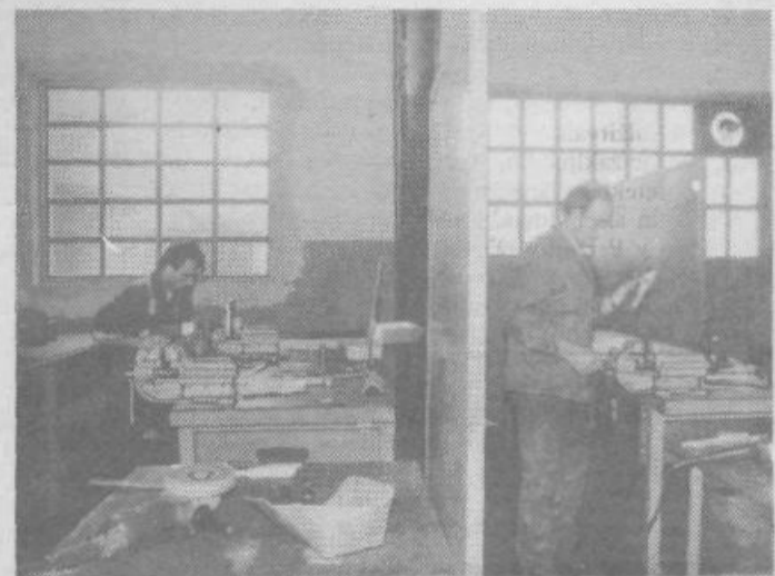
V SCT, tozda Mehanični obrati so tekmovali konstrukcijski ključavničarji