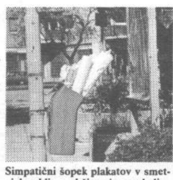
Simpatični sopek plakatov v smetnjaku blizu občine je posledica predvolilnih bojev. Škoda, ker je nameščen nekoliko »od roka«, saj ga odgovorni že nekaj časa niso izpraznili. Logično bi bilo, da ga praznijo komunalci, vendar se pri nas zadnje čase nič več ne ve kdo je za kaj odgovoren: KS, občina, ali komunalci.