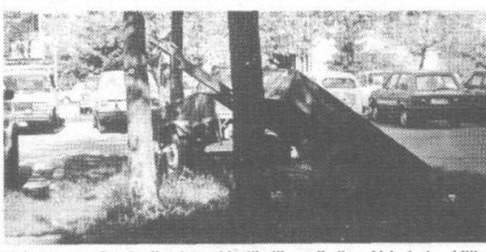
Nekoč smo v Javni tribuni že objavili sliko prikolic, ki jo je iznajdljivi lastnik Ob zici priklenil k drevesu. Verjetno je bila fotografija in ideja všeč tudi drugim lastnikom prikolic in glej ga vraga - čedalje več je posnemalcev.