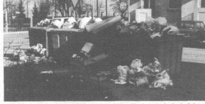
Deponija »prvomajskih praznikov« na križišču Kovinarske in Andrejaševe ulice kaže, da še nismo prav na dnu, ali pa morda ravno to.