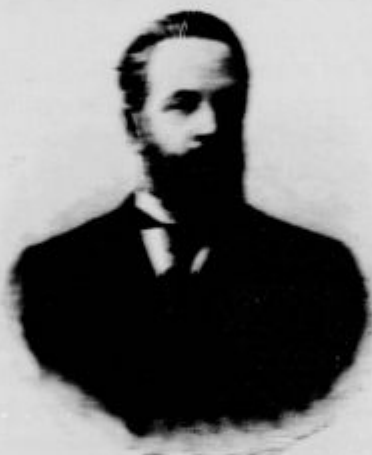
S. J. Witte naki finančni minister

ročilo njancem v svatje kamji je bil star leto 24 let, že občen n napušču samo ter prav mladega sinčka. Vredal se je s sejnja. Na Blokani v gostini pri „Bloskem namu“ je volil prodal, ter se pil pozno v noč „likof“. Ni pa hotel zapiti ves kup, zato se ga, kakor se govori, vrgli ven v reznansko mrtlo noč. Na peč n se ni ni od vstani, a n vesel miosti. Hodaš, mdaš — noriš ven za mrtlo pian! Do toma je smel še 1 ur boča. Zgredil je pot, obnemogel n — umrl bila vasi v neki kotlini. Okoli njega je bilo neki vse razkopano, korenne poljena, kar zan spritnje grozno smrt. Nagle smrti meš nas, Gospodi! Pokopali so ga pri Part za Blokani. Pogreb je bil silno žalosten. Pri- povedujejo, da je a namki že peto živje iz smernene gostilne. Varnje se, možje, pred alkoholičnimi njacami n pred takimi go- stilnami!