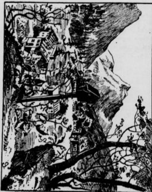
Kje je hribolezec?