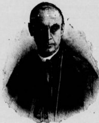
Kardinal Merry del Val.