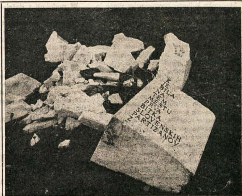
PARTIZANSKI SPOMENIK NA ROBEŽU PO ZLOČINSKEM ATENTATU