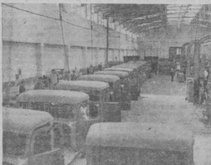
Karoserije za kamione v »FAP«

la še za eno milijardo. Za obdobje januar—julij lahko podamo naslednje podatke: Izvoz 51.147 milijonov dinarjev Uvoz (brez pomoči) 56.340 milijonov dinarjev Pasiva trg. bilance 5.201 milijonov dinarjev Pomoč 29.641 milijonov dinarjev