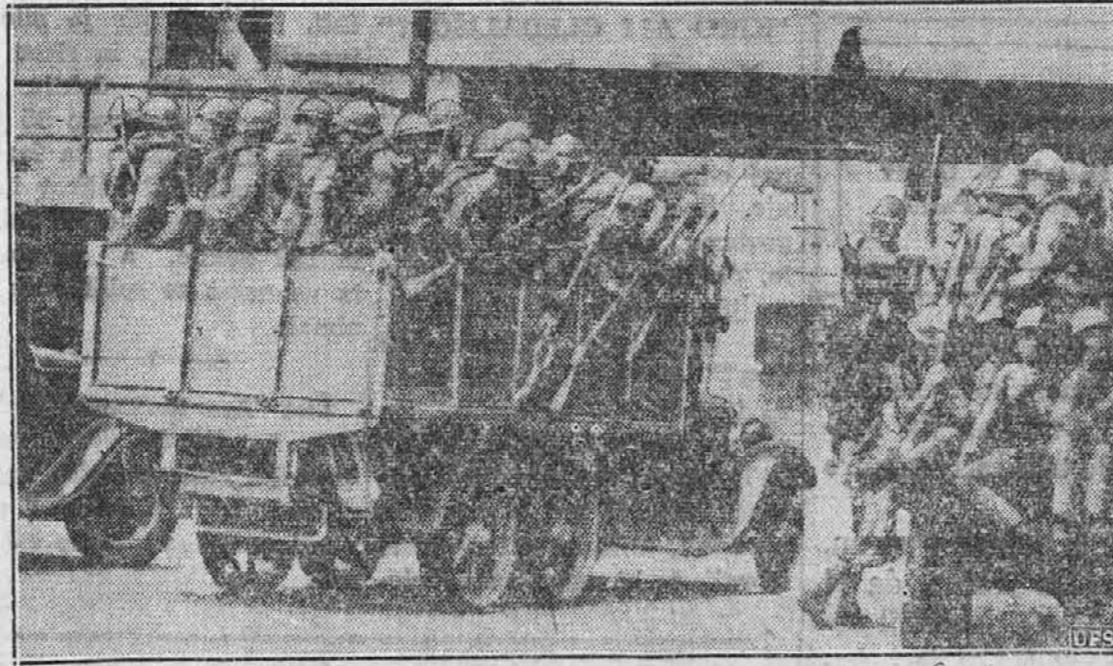
Novi oddelki japonskih čet, ki se s tovornimi avtomobili vozijo na bojišča v severni Kitajski.

3. Za danes imam jaz pripravljen poseben referat, ki ga bom imel in podal vam pozneje, ko se bo enkrat ta sestanek pravilno ustanovil. To kar sem dosedaj govoril je samo pojasnilo, kakor sem že omenil.