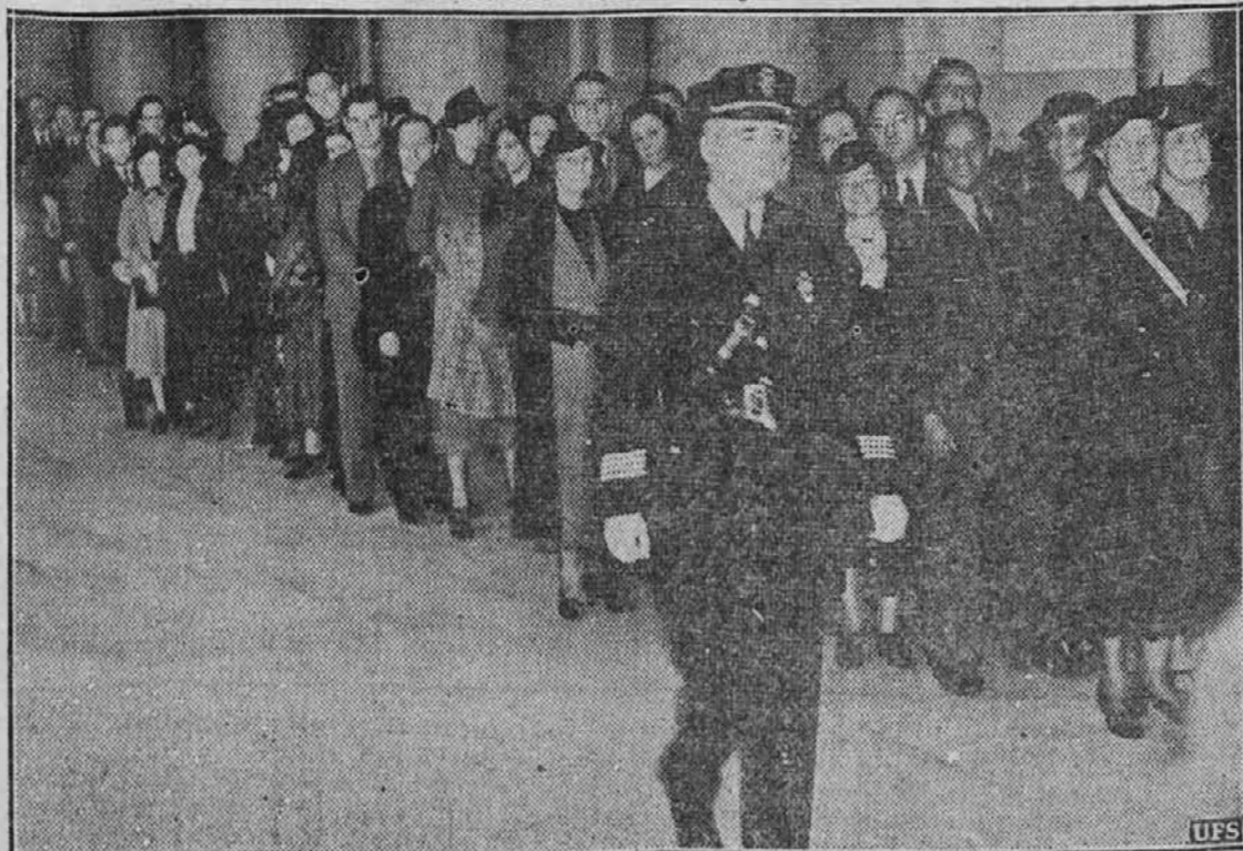
Kako zanimanje je vladalo med občinstvom, kaj bo vrhovno sodišče odločilo glede novega vrhovnega sodnika Blacka, se razvidi iz gornje slike, ki kaže del dolge vrste ljudi, kateri so čakali cele ure, da si pridobe vstop v sodno dvorano. Zadnji ponedeljek je vrhovno sodišče končno odločilo, da je Hugo Black upravičen do svojega mesta kot vrhovni sodnik.