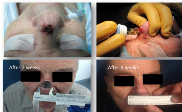
Slika 2. Zdravljenje in učinek elektrokemoterapije bazalnoceličnega karcinoma na nosu bolnika.

kratkim bil zdravljenja z 2482 glede na tumorjev, je odgovorov bolnika 83% Smo pa na pri celičnem melanomu, karcinomu izluščimo, da je histologije večji tumorji in Pomembno pa se