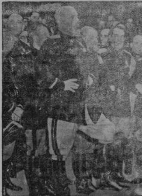
Mussolini, obdan od svojih najožjih sodelavcev