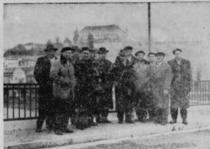
Komisija strokovnjakov po končanem tehničnem pregledu novega mostu

Vse, kar bodo še naši zgodovinarji na tukajšnjem območju v zvezi s ptujskimi lesenimi in primitivnimi mostovi minulih sto in stoletij bo nova dragocenost k že najdenim dragocenostim o graditvah ptujskih mostov skupno z najdeninami o rimskem mostu, ki jih hrani ptujski muzej. Nov ptujski most bo sedaj stoletja vezal obe obrežji Drave ob nizkem in visokem vodostaju in mirno prenašal teženje drveči sodobni promet. Vse izkušnje strokovnjakov in delavcev iz časa njegovega nastajanja pa naj služijo graditvam novih podobnih mostov v naši domovini in temu naj služi tudi vsak uspešen predlog, ki bo zadovoljeval enako kot v tem primeru osnovnim pogojem, in sicer varnosti objekta in ekonomičnosti gradnje.