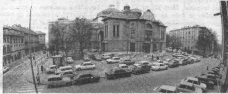
Drama: Pomembno kulturno poslanstvo, a še vedno nizki OD

UPORABA VARNOSTNEGA PASU BO KMALU OBVEZNA