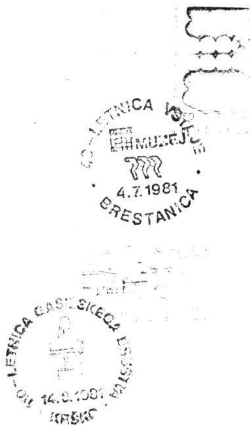
Žiga z 49. in 50. spominskega ovitka FD Krško

Pionirske razstave je društvo pripravilo ob naslednjih pri-