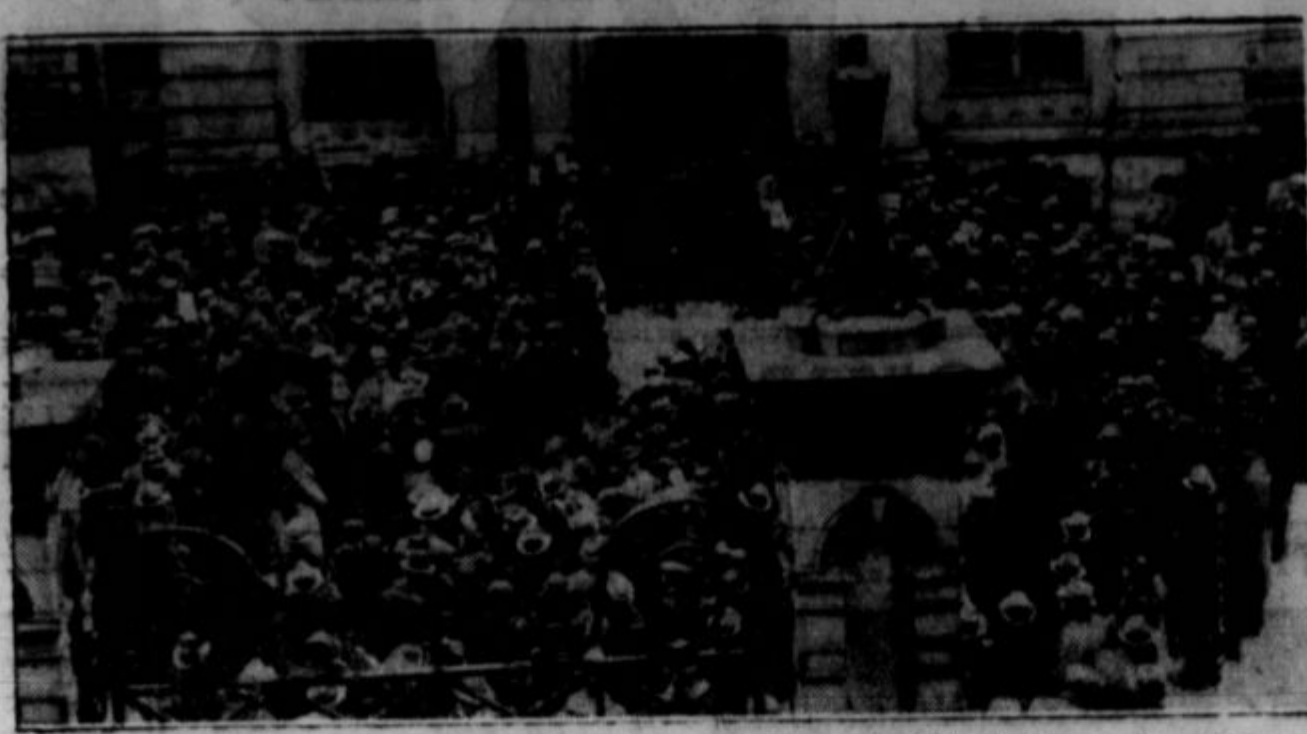
Na sliki je prizor z demonstracije hišnih posestnikov v Bostonu, ki so protestirali proti visokim davkom na posestva. Nekateri govorniki so poudarjali, da se je ameriška revolucija proti Angliji pričela v Bostonu

zaradi previsokih davkov. Svarili so, da se sličen upor lahko dogodi iz enakega vzroka proti sedanjim ameriškim oblastim, ker raspisajo z ljudskim denarjem, in povračilo pa dajejo malenkosti.