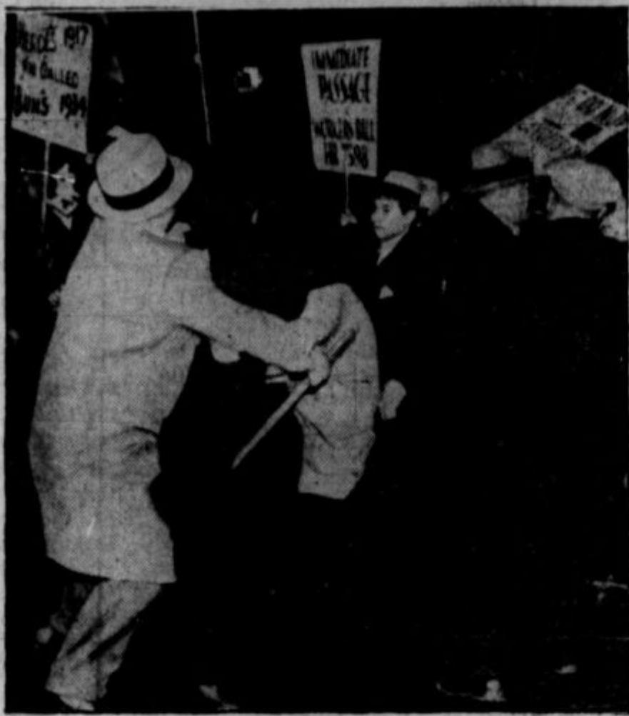
Koncem marca so prenehale službe delavcev, ki jih je preko zime zaposlila vladna CWA. Dne 31. marca so v raznih mestih demonstrirali proti ukinitju zasluzka. Kljub temu so bili odslovljeni. Na sliki je eden izmed tisočih prizorov iz demonstracij 31. marca. Detektivji razganjajo demonstrante.