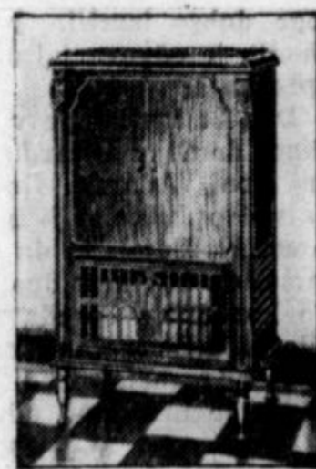
Plinski grelnik s krožilnim zvokom prihrani stroške v trgovinah, uradih in malih domovih. Delo s kurjavo odpravi, e-nako z odnašanjem pepela. Odpravi prah in ne-nago.

Na razpolago imamo plinske grelnike raznih modelov, ki nudijo udobnost vam in vašim odjemalcem. Pridite in oglejte si jih. Z veseljem bo naš zastopnik, ki pride na vaš dom, pregledal vaš prostor, napravil načrt ter svetoval, kakšen grelnik potrebujete. Pokličite Wash 6000.