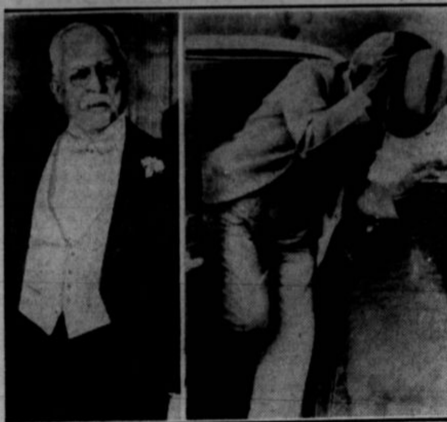
Samuel Insull je bil finančni in "utilični" car v državah osrednjega zapada. Njegovo glavno mesto je bilo Chicago. Razpolagal je s stotinami in z milijardami dolarji. Bil je "genij", ki so ga kazale učiteljice v javnih in v farnih šolah za vzor svojim učencem. Bil je patron opere. Bil je ponos Chicago, ponos Illinois, ponos Zed. držav... no, koncem konca se je čisto lahko dokazalo, da je bil navaden špekulant in prevarant. Predno pa so oblasti javnosti to priznale, so dale Insullovim kompanijam priliko, da so mu nakazale po $25,000 na leto pokojnino za zvesto sodnikovanje in ob enem so izpustile, da ga je sodišče imenovalo za enega sodnih upraviteljev podzvetij — katera je bankrotiral. Ta igra je šla nekaj časa. Ko pa se je doznalo, da segajo izgube — "prevarancije" — v našeto milijonov, so dale Federalne in lokalne oblasti Insullu vsjo priliko, in v našeto milijonov, "zaradi zdravja" v inozemstvo. Nato je bruhnil. Delničarji — tisoče in tisoče malih ljudi — so izvedeli, da so bogataši posebno skozi prve mesece krize prodali Insullove delnice navzvenem po visokih cenah — potem so "padle". Pa tudi prejšnji delničarji so izgubili milijone dolarjev. Ko je bil Insull na varnem v Grčiji, so se žele začele proti njemu intrige ameriških oblasti, zato, da so razni advokati in drugi slični šumarji zaslužili čimveč. Ta "boj" je trajal dolgo dolgo, dokler se niso grške oblasti naveličale in dale Turčiji priliko, da naj tudi ona nekaj zasluži. To je justica pod "new dealom". Na sliki na levi je Insull, kakršen je bil, ko je hodil v svojo operno palačo v Chicagu. Na desni je bil slikan v Atenah, ko se je izogibal vsiljivim časnikskim fotografom.