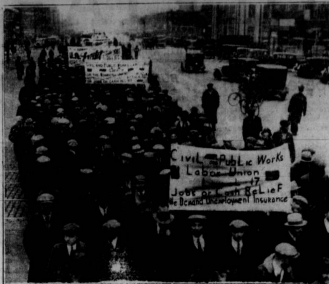
CWA je skozi prošlo zimo vpsilila par milijonov brezposelnih. Dne 31. marca jih je odsvolila. Delavci so protestirali proti temu, ker jih je groza pred novo brezposelnostjo. Na tej sliki je del njihove demonstracije, kakršne so se vršile v vseh ameriških mestih.