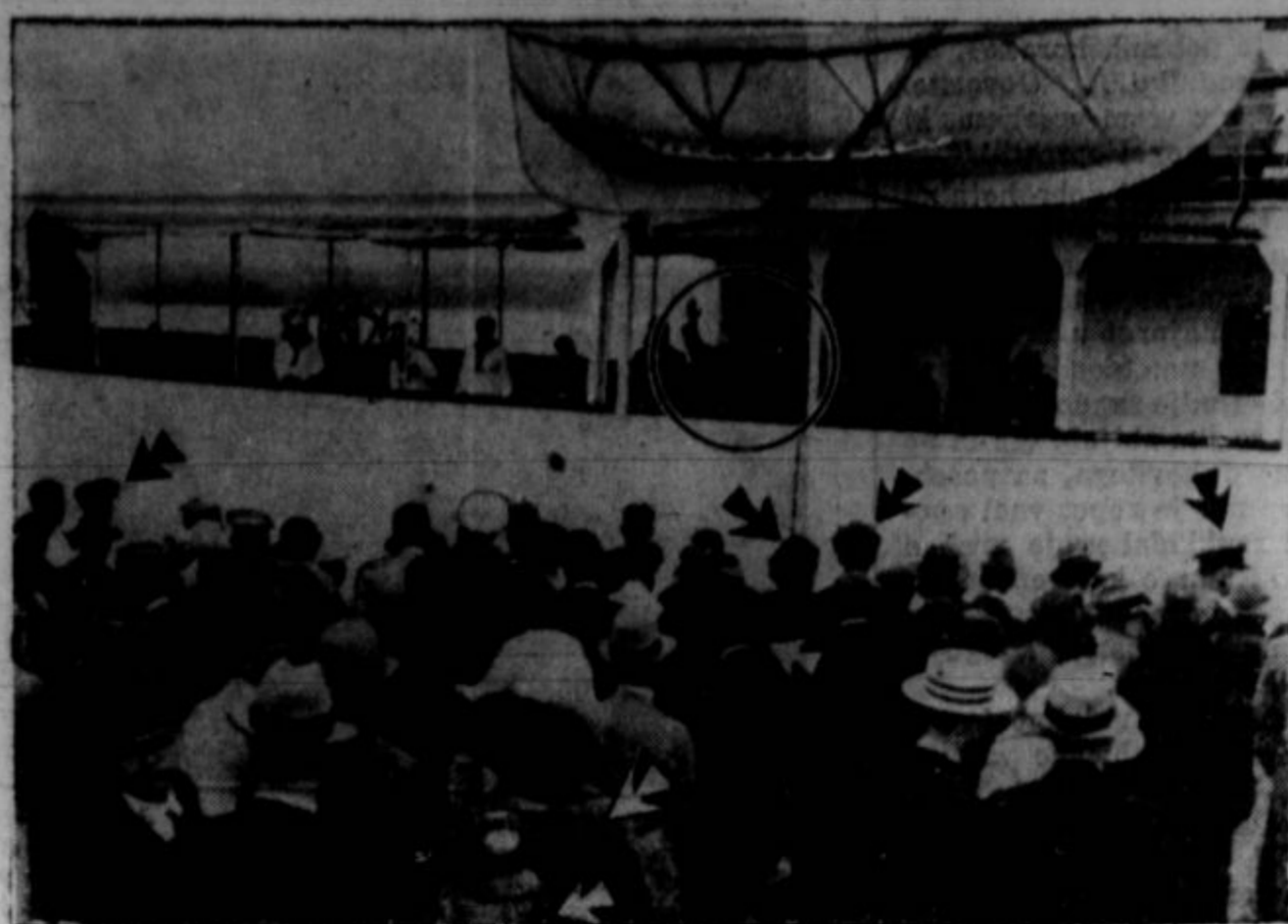
Proti predsedniku Rooseveltu je podvzeta radi njegovega "možganskega trusta" velika ofenziva, a izgleda, da se ni zmenil zanjo, kajti v najbolj vročih dneh napadanja je šel z nekaterimi prijatelji na vožnjo ob obrežju z jahto Nourmahal. Jadegnica Nourmahal je moderno opremljena ladja, ki stane nad milijon dolarjev. Krog na ladji znanuje predsednika. Ljudje ob ladji, na katere kažejo sulice, so tajni detektivji, ki spremljajo Roosevelta, v namenu, da ga ubranijo pred morebitnimi fizičnimi napadi.