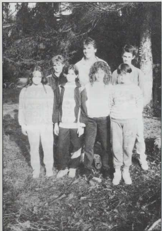
... in najstarejši v Sakalovcih

smo se odpravili h gozdarski hišici. Komaj smo čakali ta dan. Nižji razredi so se peljali z avtobusom, učenci iz višjih razredov pa smo lahko kolesarili. Ob 10. uri smo krenili izpred šole. Ustavili smo se pri Proderju, Bekavaraši in na Dolnjem Seniku. Med potjo se je Tomažu preluknjala zračnica. Ko smo prispeli, smo bili utrujeni. Zbirali smo suhljad. Kdor je hotel, je lahko pekel slanino, hrenouko. Potem smo se igrali. Nekateri so se igrali "vojno s šte-