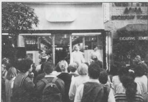
Tako je bilo minuli četrtek na Váci 10 v Budimpešti

Začetek prodaje so zaznamovali z modno revijo, ki je zaustavila številne mimoidoče, ki so lahko videli, kaj ponuja in kaj bo ponudila slovenska konfekcijska tovarna kupcem v madžarskem glavnem mestu.