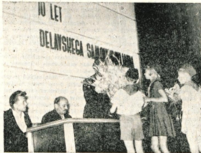
Izmed vseh čestitk in voščil na slovesni seji delavskega sveta so bili najprisrčnejši pionirji, ki so delavskemu svetu zaželeli še več uspehov v prihodnje

Po približnih ocenitvah si je letošnji 10. jubilejni Gorenjski sejem do danes dopoldne ogledalo že okoli 15.000 obiskovalcev. Računajo pa, da se bo do večera ta številka še znatno povečala.