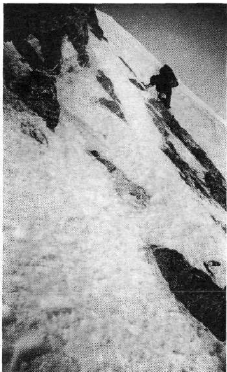
Tik nad prvim bivakom v Slovenskem steburu je bila v višini 7250 metrov nevarna strmina z ledom, snegom in skalami

kmalu po kosilu zapustila bazo. Takoj ko sva taboru obrnila hrbet, sem začel razmišljati, če imava res vse s sabo. V mislih sem pregledoval vsebino nahrbtnika in jo primerjal s seznamom. Manjkal je kuhalnik s posodo; tudi Pavle se ni spomnil, da bi ju vzel. Vrnil se je v tabor in je oboje našel v jedilnici na sodu.