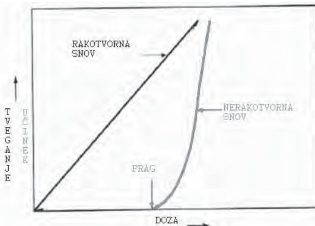
Slika 2. Shematični prikaz ocenjevanja učinka po praznem (siva krivulja) in brezpraznem pristopu (črna krivulja)

V ocenjevanju učinka, ki je druga stopnja ocenjevanja tveganja, ugotavljamo, kakšne posledice pri človeku povzročajo različne stopnje izpostavljenosti kaki snovi. Za samo poškodbo organizma je namreč pomemben odmerik snovi (količina/čas), ki pride v telo. V ocenjevanju učinka torej ugotavljamo, kakšen je odnos med odmerkom in pojavljanjem bolezni pri ljudeh. Pri nerakotvornih substancah v podatkovnih zbirkah škodljivih substanc poiščemo podatek o največji dozi, pri katerih učinkov na zdravje še ne zaznamo, oziroma o najmanjši dozi, pri kateri se učinki pojavijo. Na tej podlagi izračunamo, kakšna je največja dnevna doza snovi, ki še ne prizadene zdravja posameznika. Posameznik ji je lahko izpostavljen dnevno celo življenje.