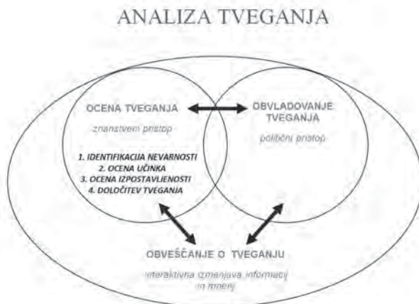
Slika 1. Shematični prikaz procesov v analizi tveganja

Pri prepoznavanju, določanju in nadzorovanju nevarnosti, ki so ji podvrženi ljudje zaradi izpostavljenosti škodljivim dejavnikom v okolju, gre za soodvisno delovanje raznih družbenih struktur [1]. Celotni proces, ki ga imenujemo analiza tveganja, je shematično prikazan na Sliki 1. Sestavljen je iz treh ločenih procesov, ki se med seboj vsestransko prepletajo in povezujejo. V ocenjevanju tveganja z znanstvenimi metodami ocenjujemo možne posledice izpostavljenosti na zdravje ljudi. Proces poteka v štirih stopnjah (identifikacija nevarnosti, oceni učinka in izpostavljenosti ter določitev tveganja), ki so podrobneje predstavljene v nadaljevanju [9, 10]. Obvladovanje tveganja je politično voden interdisciplinarni proces, v katerem se predlagajo, izbirajo in izvajajo odločitve, s katerimi se poskuša zmanjšati tveganje pri ljudeh in v ekosistemih. Izvajajo ga politiki, snovalci zakonov, gospodarstveniki, naravovarstveniki in ostali zainteresirani posamezniki. Izbira postopkov je odvisna od zaznavanja nevarnosti v prebivalstvu, družbenih norm, zakonov in standardov ter, ne nazadnje, od stroškov in učinkov. Med znanstvenim ocenjevanjem ogroženosti in političnimi prizadevanji za njeno obvladanje pa je treba ugotovitve, zaključke ter predvidene ukrepe predstavljati ogroženim prebivalcem ter poskrbeti, da jih pravilno razumejo in upoštevajo.