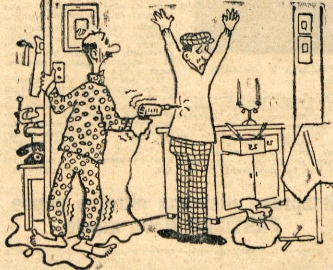
»Samo premakni se, pa te prevrtam kot desko!«

Takega »dvojca« v naših dolenjskih gozdovih že dolgo ni bilo.