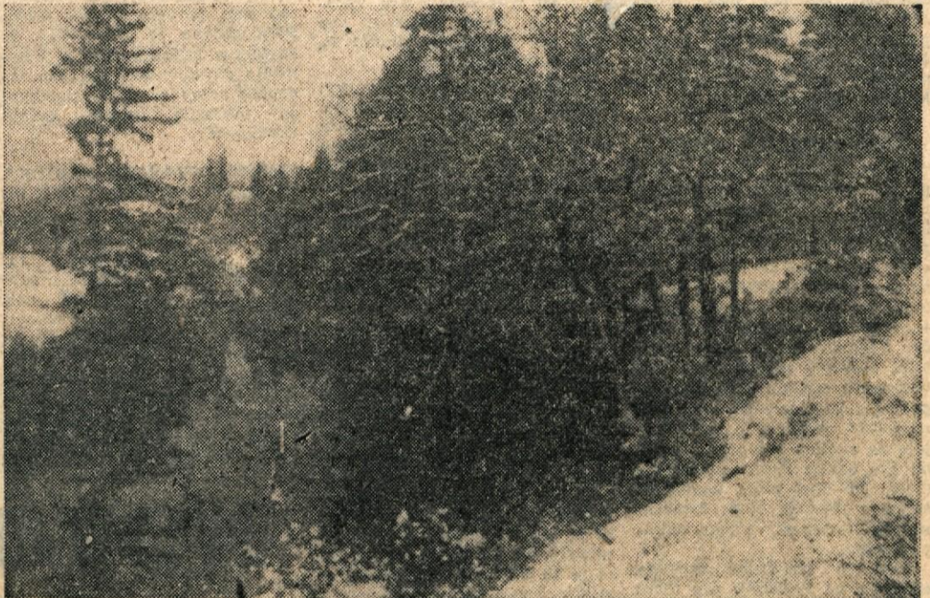
Medlo sije sonce te zadnje jesenske dni, marsikdo po Dolenjskem pa smo bili v prejšnjem tednu še kar sredi snega, ki še ni skopnel. Naš fotoreporter je ujel tak motiv tudi ob Lahinju v Beli krajini...

Tudi v občini Straža — Toplice se vneto pripravljajo na proslavo v počastitev dneva JLA. V ta namen je sestavljen odbor, ki bo pripravil in vodil proslave kakor tudi razna predavanja o Dnevu JLA. Sodelovanje so obljubili tudi pripadniki JLA iz Novega mesta; priredili bodo koncerte in predvajali vojaške filme v Straži in Dolenjskih Toplicah, verjetno pa tudi v Podturnu in pa Vršnih selih. V Dolenjskih Toplicah bo koncert v nedeljo, 18. decembra ob 19. uri, pred tem pa bo predvajanje filmov, v Straži pa v četrtek, 20. decembra in bo program od 4 ure popoldan dalje. Za te nastope pripravljajo svoje točke tudi ostale organizacije in župe.