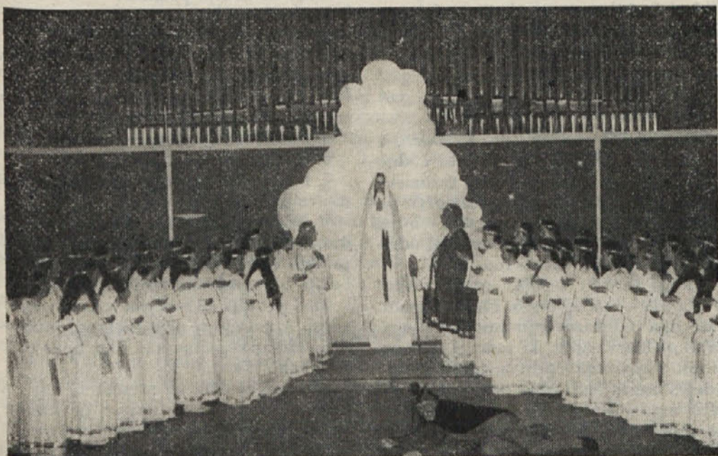
Prizor iz misterija „Brezmadežna“.

Kongres je povedal svoje, njegova številna iznenadenja so zgovorna. Strah in malodušje, zagrenjenost in obup nad časom in prilikami in še nestrpnost in sovraštvo so sadovi plitvin in praznin. Pogum, jasen pogled naprej in vera v zmago idealizma nad temo je prvina katoliškega dela in življenja. Da smo spoznali in dojeli resnico, je najlepše darilo kongresnih dni. Marijino darilo vsem, ki se hočejo v njenem duhu boriti in žrtvovati za Kristusovo kraljestvo na zemlji.