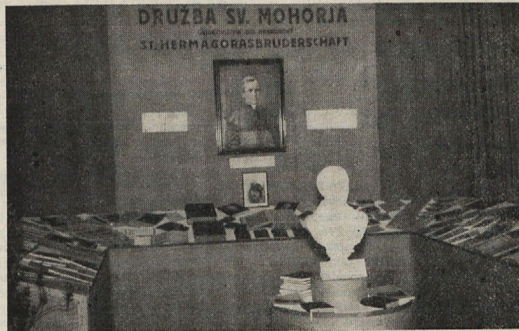
Pogled na razstavo Družbe sv. Mohorja v okviru razstav „Ziva Cerkev“ in „Marija v knjigi“.

glo prikazati vsako ljudstvo. Nastopati je morala v tej veličastni igri, prikazujoči odločitev za Marijo ali proti njej v svetu angelov, mladina, ki je še neokužena po civilizaciji in strupu naših dni. Le notranje čista, nedolžna mladina je mogla podajati dejanja iz misterija, o katerih borno človeško srce le sluteč sanja in jim ne ve oblike in načina. Za ta misterij je bilo potrebno bolj notranje doživetje nastopajočih kakor pa oderski talenti in zunanji učinki. Potek akademije in njegov uspeh sta častno spričevalo tako prirediteljem kakor tudi nastopajoči dekliški in moški mladini. Tako je mladina sama pokazala, kako si želi tudi svoj bodoči kulturni razvoj in kako hoče uresničiti tudi svojo prosveto.