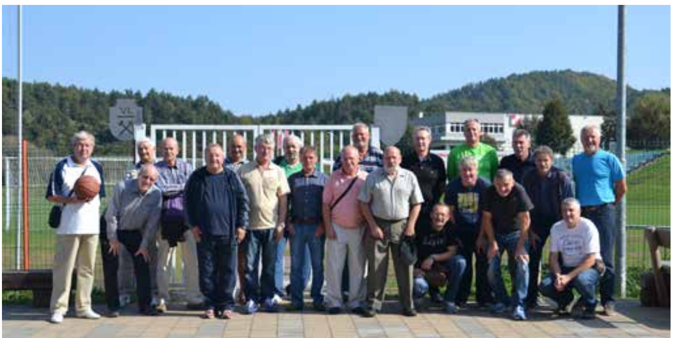
Udeleženci srečanja (na sliki ni vseh udeležencev)