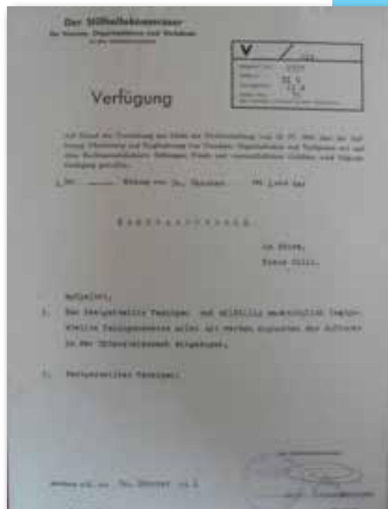
Razpust Strelskega društva Štore leta 1941

povedjo rabe slovenskega jezika je nacistični Ukinitveni komisar za društva in organizacije na Spodnjem Štajerskem ukinitel Strelsko društvo Štore 30. oktobra 1941. Po končani 2. svetovni vojni je strelsko dejavnost obudilo in nadaljevalo strelsko društvo Kovinar Štore, ki je bilo ustanovljeno leta 1948 in deluje še danes.