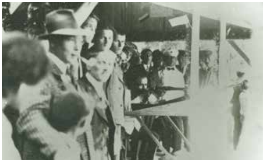
Na strelišču za gostilno Franci med obema vojnoma (Zgodovinski arhiv Celje)

neprecenljive zasluge, finančno pomoč pri ustanavljanju društva in pripravo samega strelišča.