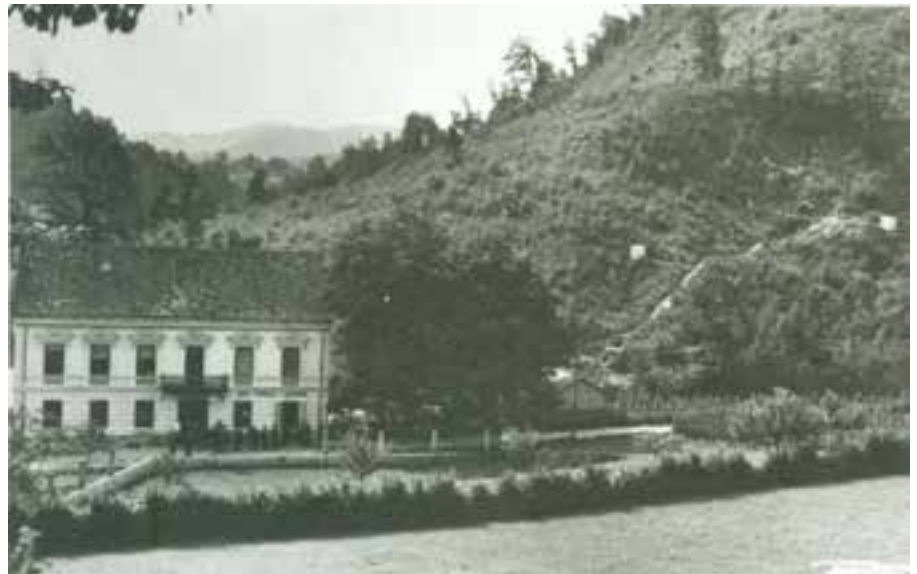
Gostilna Francl s streliščem v ozadju

Člani društva pa so si morali napraviti in urediti strelišče. Pomoč so našli v vodstvu industrijskih obratov v Štorah. Strelišče so si