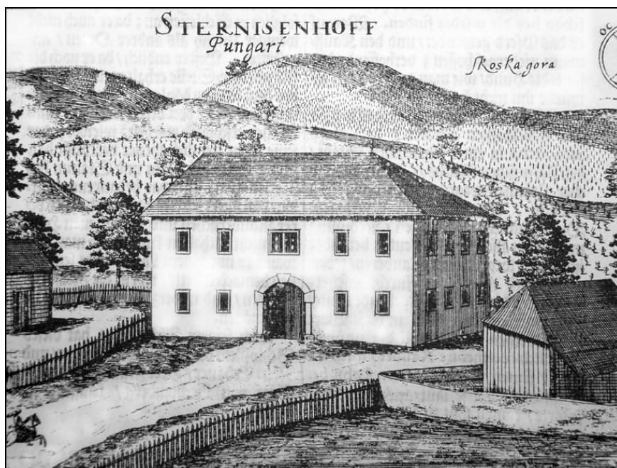
Dvorec Turn-Pungrt-Strnišev dvor (Sternissenhof) po Valvasorju (Valvasor, Die Ehre XI , str. 563).