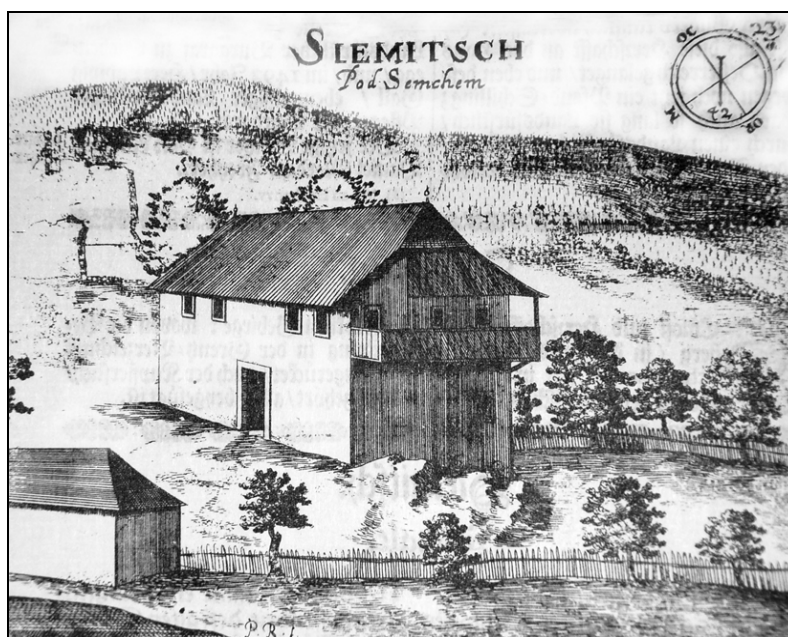
Grad Semič po Valvasorju ( Valvasor, Die Ehre XI, str. 530 ).