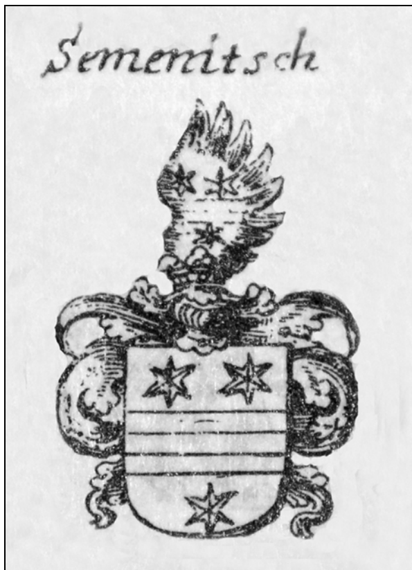
Slika Semeničevega grba po Valvasorju ( Valvasor, Die Ehre IX, str. 118 ).

Verjetno je bilo to res sredi 16. stoletja, ko je bila turška nevarnost še vedno prisotna in je bilo novo grajsko poslopje zgrajeno še razmeroma visoko, vseeno pa je bilo bivanje v njem udobnejše kot v stari utrdbi. Skoraj neverjetna pa je trditev, da naj bi prvotni grad v letu 1547 razdejali Turki, saj se tako visoko postavljenih in težko dostopnih zgradb praviloma niso lotevali, razen če res ni stal precej nižje na neki še neugotovljeni lokaciji. V tem letu so Turki dejansko opustošili Belo Krajino in ljudje si od tega napada še dolgo časa niso opomogli. 31