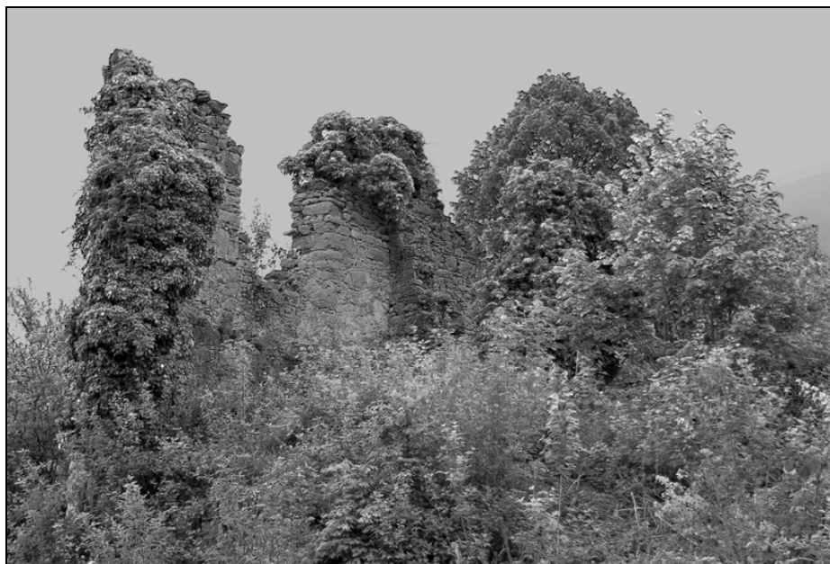
Razvalina gradu Smuk.

Na ožjem območju Semiča je nekoč stalo pet grajskih poslopij, vsako s svojo usodo in usodo svojih lastnikov. Kaj je ostalo od nekdanje veličine? Semenič, najstarejši grad na vrhu Semiške gore, domnevno postavljen konec 12. stoletja, je bil zapuščen že konec 16. stoletja, njegov malce udobnejši naslednik in bližnji sosed Semič nad Gabrom se je