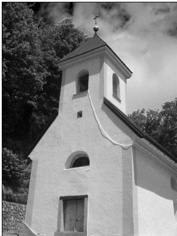
Obnovljena cerkvica Sv. Primoža in Felicijana nad Gabrom.

V Valvasorjevem času je semiška župnija sv. Štefana obsegala že 13 podružnic, vključno s cerkvico nad Gabrom. Valvasor omenja grajsko kapelo v gradu Krupa, ne omenja pa nobene grajske kapele v dvorcu Semič. 16