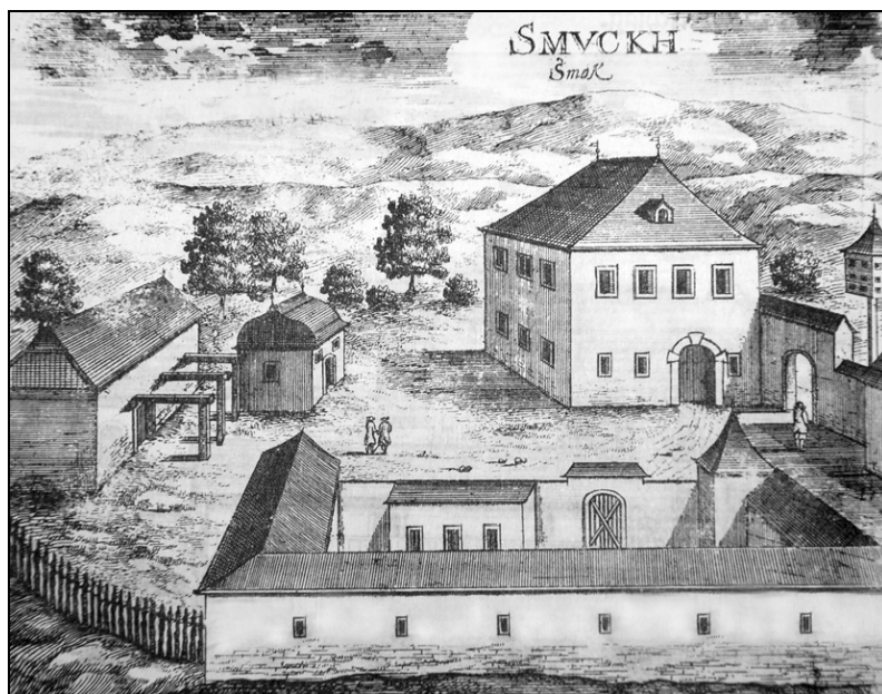
Dvorec Smuk po Valvasorju ( Valvasor, Die Ehre XI, str. 538 ).