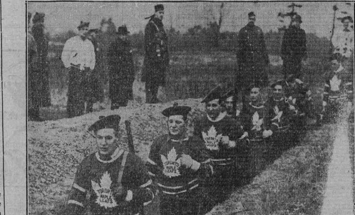
Člani neke lige za igranje "hockey" v Kanadi so opustili svojo igro in se pričeli vezibati v orožju za slučaj, da bodo pozvani v vojake. Slika jih kaže pri teh vezibah v nekem strelskem jarku blizu mesta Toronto, Ont.