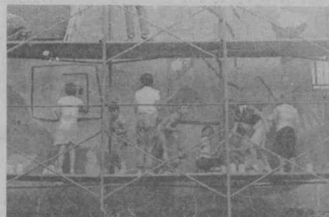
Pri domu krajevne skupnosti Urške Zatler in 7. september so otroci risali na steno.

Kumar in spomenik na kraju, kjer so se štirje skojevci s Posavja 7. septembra 1941 spopadli z italijansko patroljo.