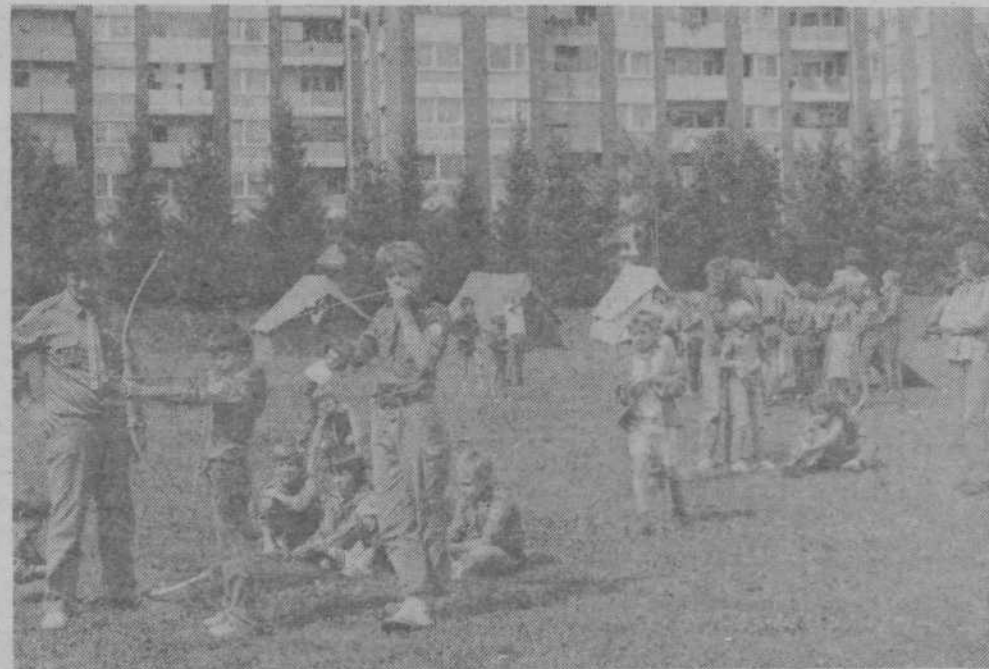
Taborniki odreda Posavski kurirji so se zbrali v parku med Glinškovo ploščadjo in Mucherjevo ulico in prikazali svoje veščine.