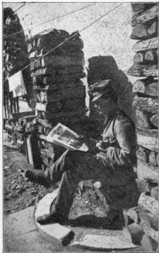
Ranjenec si krepi dūšo z dobrim čitenjom.

svojemi g. plivanoši: »Hvala Bogi, rana je nej smrt-nonosna. Prečista Devica Marija nas je nej zaverгла. Pa več nas je šče ranjenih. Ednoga je krugla v spodnjem teli zadela. Zadnje njegove reči so te bile: Lübléni so-bojniki, molite edno Zdravo Marijo . On sam je tüdi molo pa gda te reči pravo: Pod tvojo obrambo šetüjemo , je