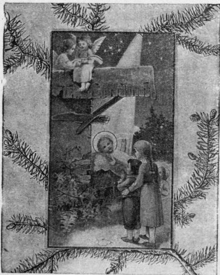
Jezušek, oča sirot.

tolážba za vás, ka ste oči takše veselje, takše srečo, takše blaženstvo voščile z svojov zgübov, kákše milijon i milijon svetóv vse radosti i dragocenosti niti doségnoti ne morejo? Ne je lübo to vašemi srci, ka máte vüpanje, ka vam je oča, mož ne pogüblen, nego gléda Bože lice?