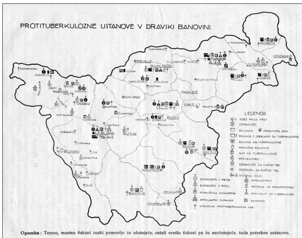
Slika 1: Protituberkulozne ustanove v dravski banovini v letu 1936