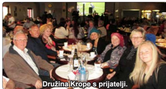
Družina Krope s prijatelji.