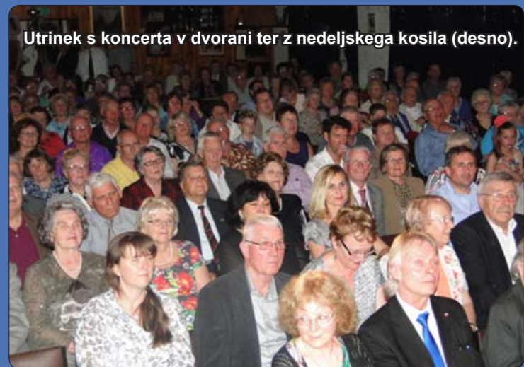
Utrinek s koncerta v dvorani ter z nedeljskega kosila (desno).