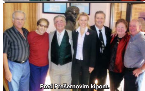
Pred Prešernovim kipom.