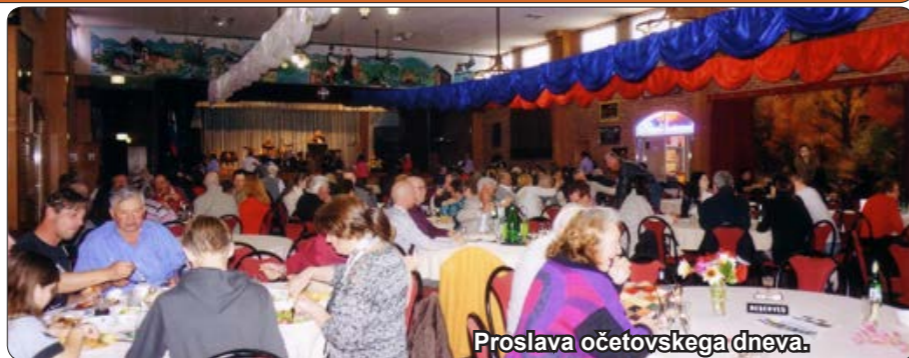
Proslava očetovskega dneva.

V nedeljo, 5. oktobra 2014 popoldan, je bil »oktober fest«. Za zabavo in ples je od 2. do 6. ure igral ansambel Alpski odmevi . Restavracija je bila odprta ob 12. uri. Člani ansambla so bili oblečeni v bavarske narodne noše, v svojih narodnih nošah pa so prišli tudi Avstrijci in Nemci, ki so se udeležili zabave. Bilo je okrog 140 obiskovalcev.