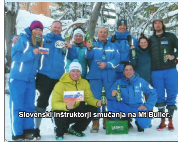
Slovenski inštruktorji smučanja na Mt Buller.