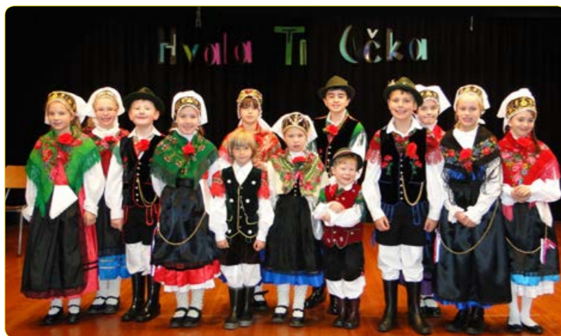
Učenci Slomškove šole so nam pripravili lep program za očetovski dan.