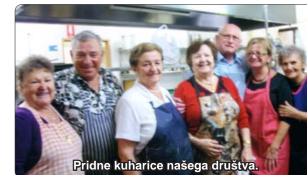
Pridne kuharice našega društva.