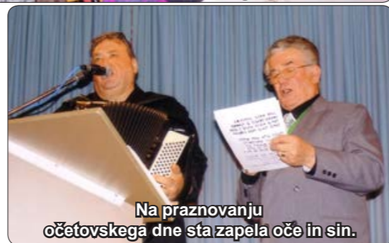
Na praznovanju očetovskega dne sta zapela oče in sin.