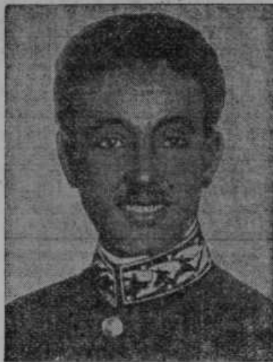
Ras Nasibu, bivšemu abesinskemu cesarju H. Selasiju zvesti poglavar Abesincev

Prekmurja, torej čitatelji »Gospodarja«, od začetka do konca, šele potem boste zvedeli za vse dogodke v svetu in v Prekmurju.