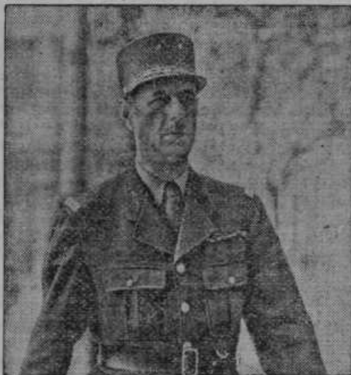
Četnik na delu, vojska avstrijskih francoskih, kojega čete so na delu, da pomorejo Angležem od juga pri prodiranju v Tripolitani

Vse čitajte! Dosti je takih naročnikov iz Prekmurja, da prečitajo samo dopise pod Slovenska krajina. Opazili smo pa v zadnjih dveh številkah »Gospodarja« pod »Novice iz domačih krajev« več pomembnih dopisov iz