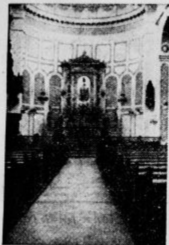
Notranjost katoliške cerkve v Solunu

Vzhodna obala Solunskega zaliva je čista in ne povzroča skrbi, zahodna je sipitaeta in peščena. Pesek nanašajo reke Salamrija, Bistrica in Vardar. Nekoč je bil Solun s sedanjim pristaniščem vred veliko jezero. Nato se je to celo področje vdrlotako da je do Soluna prodrla morje in je nastal sedanjí zaliv, na severu pa je ostala močvirnata,