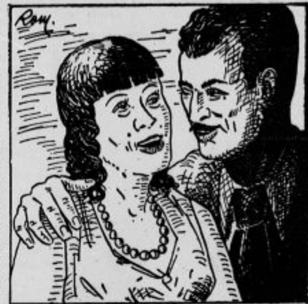
»Pa sva jih ugnala, te proklete furmane!«

»Pa sva jih ugnala, te proklete furmane!« Imenitno sva jih ugnala!« je povzela Elza in se tesno oklenila palirja.