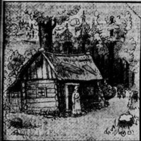
Tinčetova mama je ravno na pragu stala.

Tinčetova mama je ravno stala na pragu in se razgledovala po vremenu, ko je pridrdrala grajska kočija pred kočjo. Mati Ana, ki je bila že v skrbeh zavoljo Tinčeta, se je kar razveselila, ko ga je zagledala zdravega in čilega.