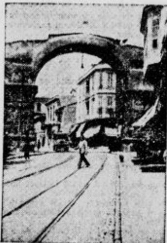
Galerijev slavolok na »Via Ignatia«

V prejšnji svetovni vojni je bil Solun važna vojaška točka od koder se je pričela znana solunsko ofenziva. Pri Solunu je tudi okostnica 6000 erbekih vojakov in dobrovoljcev, padlih v bivši svetovni vojni.