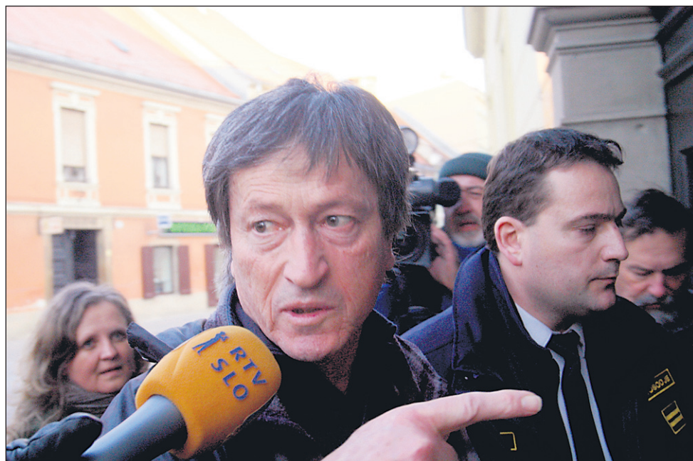
Obtoženi je pred vstopom v hišo pravice dejal: »Danes bom zahteval premestitev obravnave na nevtralnno sodišče, ker tožim tudi sodnike – na evropsko sodišče jih tožim.«