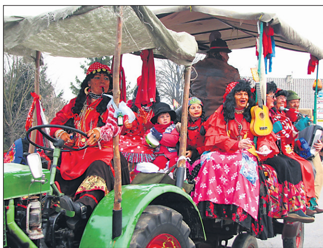
Znani dornavski cigani so se v minulem letu pošteno sprli.

Sicer pa naj bi se, kot reče, nesoglasja in trenja znotraj društva začela že prej. Slodnjakova, ki je sekcijo ciganov vodila zadnja štiri leta, pravi, da so se težave z vodstvom društva pravzaprav pojavljale skozi ves čas in se počasi stopnjevale do vrhunca: