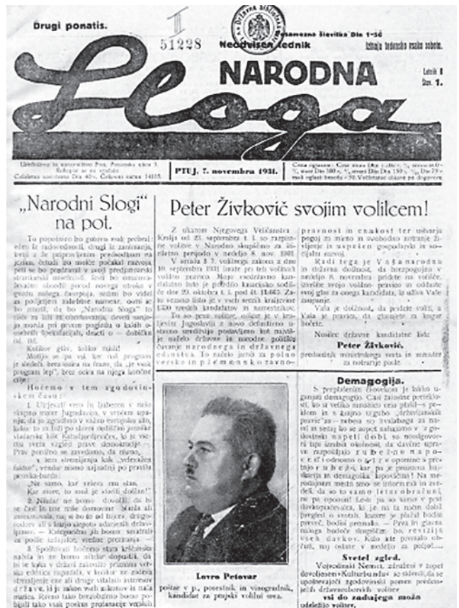
Nardna sloga ni dočakala niti svoje prve obletnice.

Ptujski tednik je nepretrgoma izhajal nadaljnjih deset let, njegov obseg pa je s štirih strani narasel na šest strani tedensko. Med tem je postal glasilo SZDL ptujskega okraja, njegovo izdajanje pa je prevzel novoustanovljeni istoimenski zavod s samostojnim financiranjem.