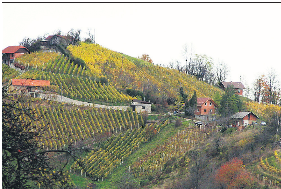
Obdobje subvencionirane integrirane pridelave grozdja se počasi zaključuje, vinogradniki s strmimi vinogradi pa lahko v tem letu še vstopijo v ukrepa V30 ali V40, v katerih plačila po hektarju niso majhna.

Kot rečeno, pa je vlada do leta 2014 določila dvoletno prehodno obdobje, v katerem je ukrep integrirane pridelave še veljaven. Tako bodo lahko tisti vinogradniki, ki bodo vztrajali pri integrirani pridelavi, še naprej pridobivali sredstva za te namene, vendar kot rečeno le še dve leti: „Tisti, ki bi to želeli, lahko podaljšajo ukrep, vendar veljajo določeni pogoji: v ukrep se lahko prenesejo vse površine kot doslej, vinogradnik jih lahko poveča za največ 20 odstotkov, lahko jih pa tudi zmanjša za največ 10 odstotkov. Prav pri zmanjšanju vinogradniških površin pa se pojavljajo težave. Namreč, veliko vinogradnikov ima površine v zakupu in tisti, ki se jim je zakupna pogodba zdaj iztekla, so v nemajhnih težavah. Če je namreč izguba zemljišč večja kot 10 odstotkov, avtomatsko ne morejo več sodelovati v ukrepu integrirane pridelave, s čimer izgubljajo določena sredstva. V zvezi s to težavo smo že urgirali in prek zbornice obvestili pristojno ministrstvo, vendar nič ne kaže, da se bo lahko kaj rešilo. Očitno bodo pač ti vinogradniki, če ne bodo zakupili novih vinogradniških površin, naslednji dve leti ostali brez denarja iz naslova integrirane pridelave grozdja. Za leto 2014 se pa tako in tako predvidevajo novi ukrepi, med katerimi sedanega ukrepa integrirane pridelave ne bo več oziroma se bo subvencionirala kakšna modificirana oblika te pridelave,“ je pojasnil Rebernišek in še dodal, da tistim vinogradni-