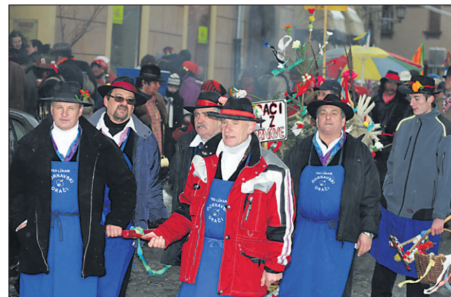
Dornavski orači bodo tudi letos 2. februarja opolnoči zazorali po občini in prevzeli oblast v času pustovanja.