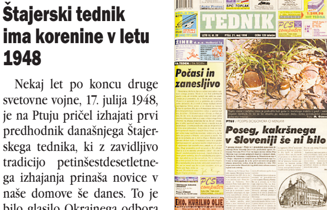
Štajerski tednik z zavidljivo tradicijo petinšestdesetletnega izhajanja prinaša novice v naše domove še danes.

Nekaj let po koncu druge svetovne vojne, 17. julija 1948, je na Ptuj prišel izhajati prvi predhodnik današnjega Štajerskega tednika, ki z zavidljivo tradicijo petinšestdesetletnega izhajanja prinaša novice v naše domove še danes. To je bilo glasilo Okrajnega odbora OF Ptuj, ki so ga poimenovali Naše delo. Prvo leto je izhajal kot štirinajstdnevnik, nato pa je postal tednik, saj kot so v