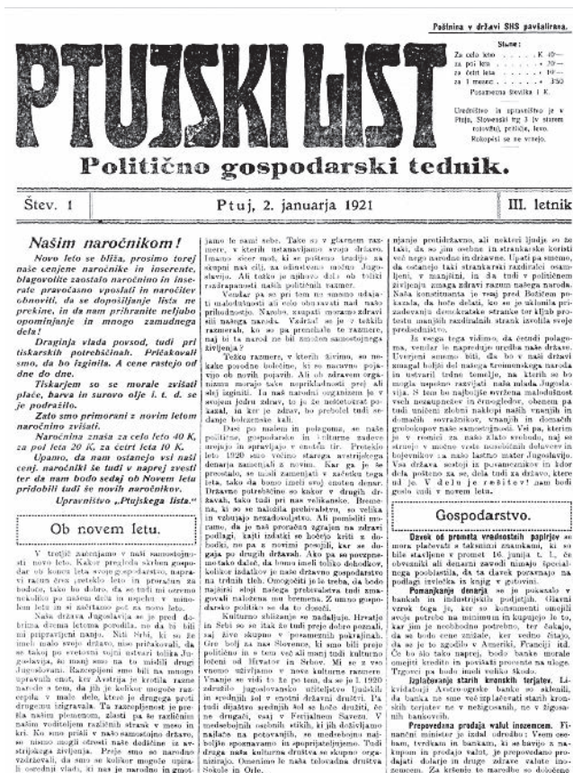
Politično-gospodarski tednik Ptujski list je izhajal le tri leta.