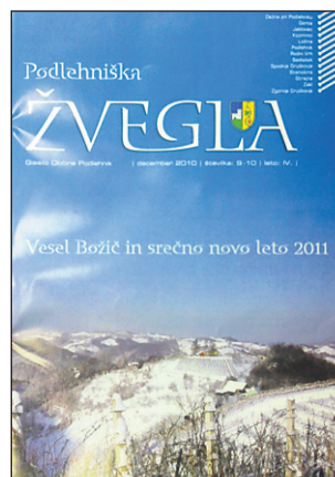
Zadnji izvod Podlehniške žvegle je izšel decembra 2010.