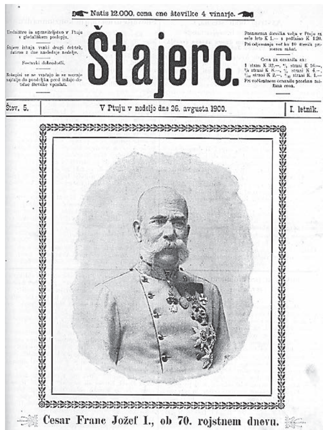
Prvi časopis, ki je na Ptuj prišel izhajati v slovenskem jeziku

Knjižnica Ivana Potrča je v sodelovanju z Narodno in univerzitetno knjižnico ter družbo Radio-Tednik Ptuj v Digitalno knjižnico Slovenije umestila stoletno obdobje ptujskih časopisov od leta 1900 pa vse do leta 2010. Časopisi Štajerc, Ptujski list, Narodna sloga, Naše delo, Ptujski tednik, Tednik in Štajerski tednik so v digitalni obliki prosto dostopni na spletnem naslovu slovenske digitalne knjižnice www.dlib.si .