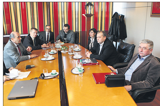
Srbska delegacija iz Bačke Topole v pogovoru z vodstvom Perutnine Ptuj