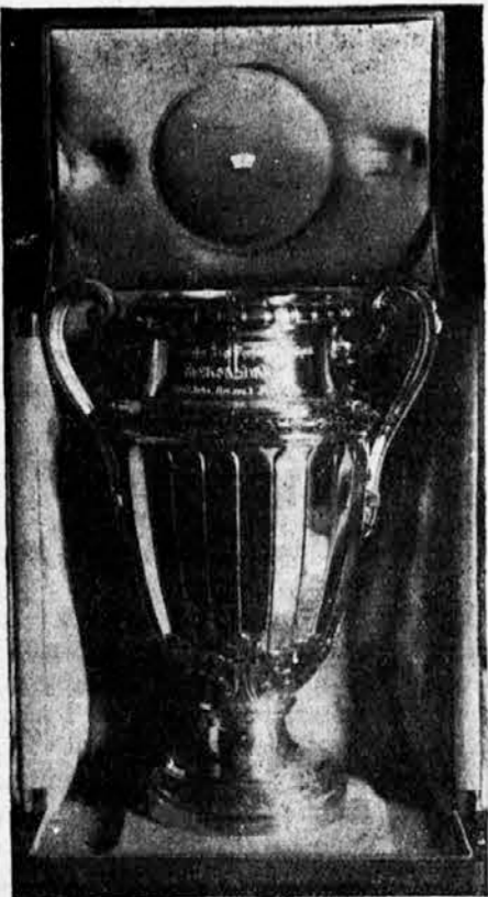
Prelazni dar Nj. V. Kralja Aleksandra I. poljskom Sokolstvu.