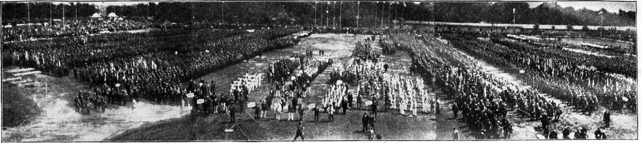
Zbor Slovenskog Sokolstva pre povorke na sletištu u Poznanju.

VII. slet Sokolstva Poljskog u Poznanju. — Utakmice Saveza „Slovensko Sokolstvo“. — Pokrajinski slet ČOS u Plznu i Orlovu.