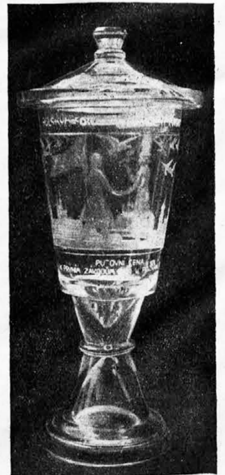
Prelazni dar prezidenta T. G. Masaryka poljskom Sokolstvu.