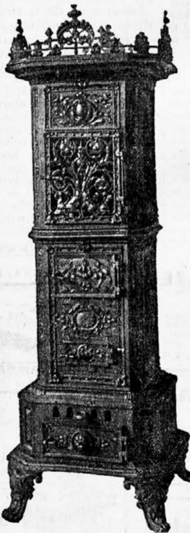
Salonska peć za ugljen.

Poštanska i željeznička stanica: Vareš — Majdan